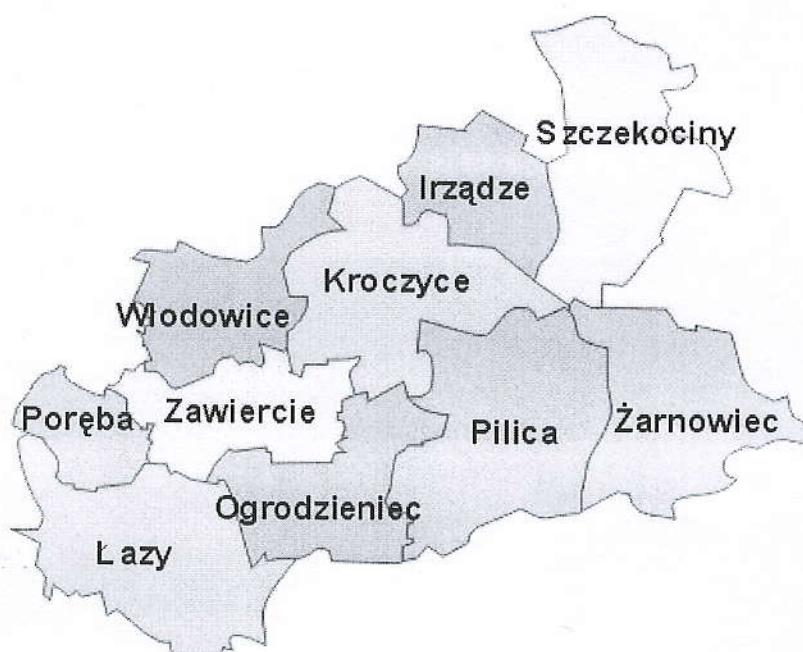
Rysunek 1. Gmina Ogrodzieniec w powiecie zawierciańskim

Gmina Ogrodzieniec zajmuje obszar 85 km 2 . Według danych GUS z końca 2015 roku Gmina liczy 9.223 mieszkańców, a gęstość zaludnienia to w przybliżeniu 109 osób/km 2 . Gmina Ogrodzieniec leży w południowej części powiatu zawierciańskiego. Bezpośrednio graniczy z następującymi jednostkami: Klucze, Kroczyce, Łazy, Pilica, Zawiercie.