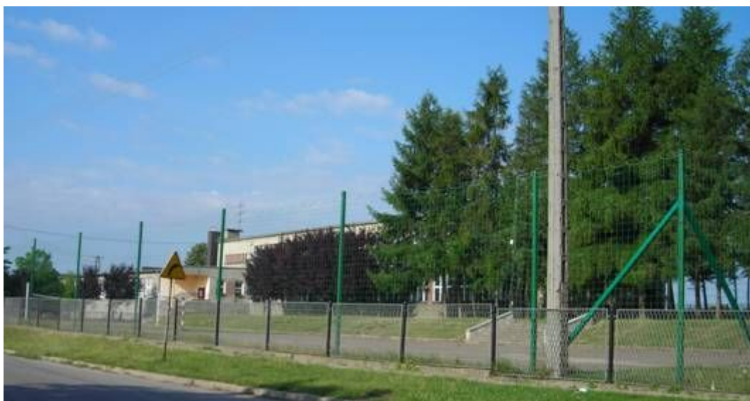
Fot. 9. Szkoła Podstawowa i boisko szkolne w Giebło

W gminie Ogrodzieniec funkcjonują trzy obwody szkolne szkół podstawowych. Do jednego z nich należy Szkoła Podstawowa w Giebło do której uczęszczają uczniowie z sołectw: Giebło, Giebło Kolonia, Gulzów, Kielkowice, Mokrus. Absolwenci szkół podstawowych uczęszczają do gimnazjum gminnego w Ogrodzieńcu.