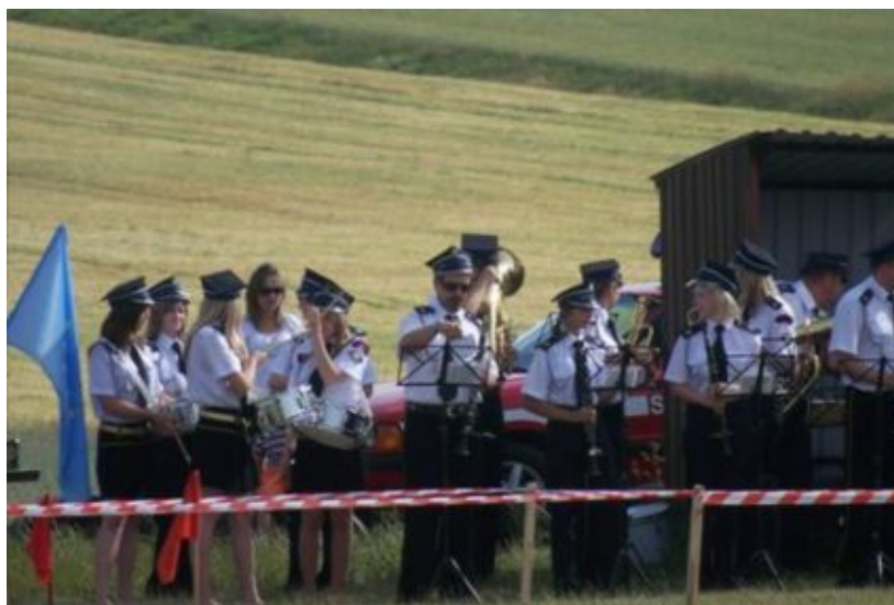
Fot. 12. Zawody sportowo-pożarnicze 6.07.2008r

Działalność kulturalna na terenie Gminy Ogrodzieniec prowadzona jest przez Miejsko-Gminy Ośrodek Kultury, który organizuje warsztaty tematyczne plastyczne, muzyczne i taneczne dla dzieci i młodzieży. MGOK w Ogrodzieńcu organizuje imprezy cykliczne: kino plenerowe organizowane na zamku ogrodzieńskim w Podzamczu, przeglądy folklorystyczne kół śpiewaczych i muzycznych. Pod patronatem Domu Kultury działa Orkiestra Dęta OSP Giebło, która liczy ponad czterdziestu członków. Mieszkańcy Giebła wykazują dużą aktywność w wydarzeniach kulturalnych i biorą w nich aktywny udział.