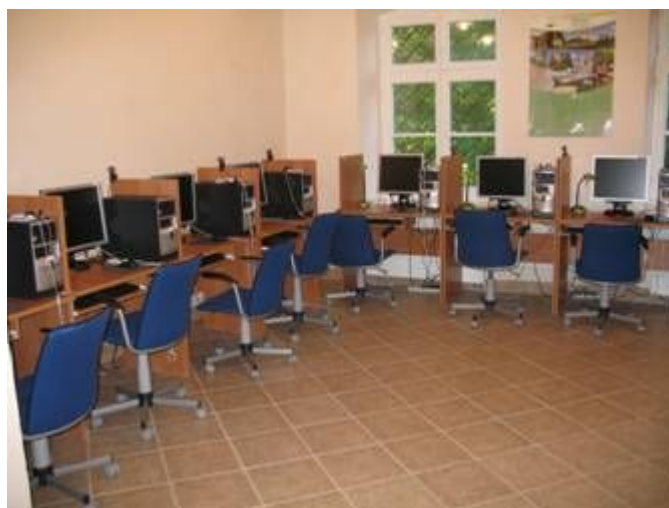
Fot. 10. CKNONW w miejscowości Gieblo.

Głównym celem Projektu jest promowanie idei kształcenia przez całe życie poprzez uczestnictwo w kursach e-learningowych. Centrum zostało wyposażone w sprzęt komputerowy wraz z oprogramowaniem, komplet mebli biurowych oraz niezbędny sprzęt służący do obsługi Centrum, taki jak telefaks, drukarkę itp. Projekt CKNONW posiada bogatą ofertą szkoleniową, a dzięki zastosowaniu technik nauczania zdalnego, każdy uczący się może indywidualnie kształtować swój plan nauki, w zależności od potrzeb i możliwości.