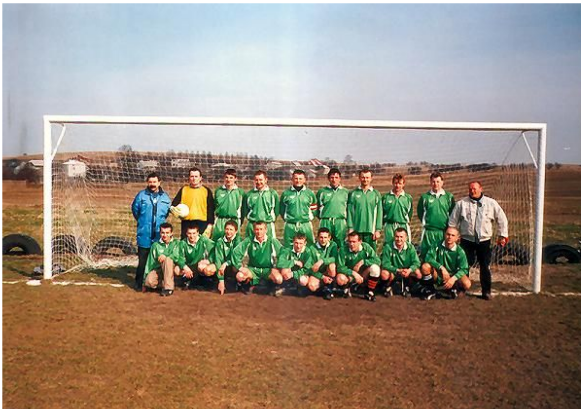
Fot. 13. Klub sportowy KS Giebło

Istniejący we wsi od 2002 r. klub sportowy KS Giebło prowadzi trzy drużyny piłkarskie w sekcjach seniorów (20 osób), juniorów (15) oraz trampkarzy (40). W klubie trenuje również młodzież z Mokrusa, Kielkowic, Gulzowa. Piłkarze rozgrywają mecze lidze „B”. Corocznie drużyna uczestniczy w turnieju halowym zawierciańskiej ligi „piątek”. W 2008 roku KS Giebło zajęło 3 miejsce w II lidze zawierciańskiego futsalu. W 2005r. w konkursie odnowy wsi w kategorii najlepsze przedsięwzięcie klub KS Giebło otrzymał wyróżnienie Marszałka Województwa Śląskiego za budowę boiska piłkarskiego. W okresie letnim członkowie klubu sportowego organizują festyn, w którym uczestniczy kilkaset osób z terenu gminy i okolicy. Festynowi towarzyszy mecz oldbojów – mieszkańców.