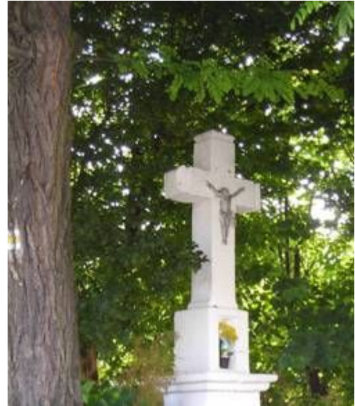
Fot. 2. i Fot. 3. Studnia i kapliczka przy ulicy Częstochowskiej.

W 1914 roku Giebło znalazło się na linii frontu I wojny światowej. Podczas bitwy austriacko-rosyjskiej liczne pociski trafiły w kościół parafialny nie wyrządzając większych szkód. Na cmentarzu pochowanych zostało w zbiorowej mogile około 100 austriackich i rosyjskich żołnierzy. Po utworzeniu w sąsiednich Biskupicach cmentarza wojskowego przeniesiono tam żołnierzy z giebelskiego cmentarza. Podczas II wojny światowej ze wsi wywieziono na roboty do Niemiec 40 mieszkańców, a powróciła jedynie połowa. W czasie okupacji rozstrzelano pięć osób, dwoje aresztowano, spalono dom mieszkalny i zabudowania. Mieszkańcy zaangażowali byli w ruchu oporu, głównie w Batalionach Chłopskich.