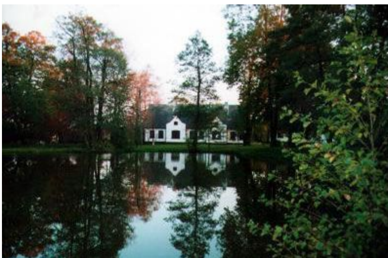
Fot. 6. Dworek szlachecki z XIX w.

W Gieble zachowały się charakterystyczne budynki mieszkalne i gospodarcze, 2 studnie z XIX wieku z kołowrotkami dwukołowymi, kapliczki i krzyże przy ul. Edukacyjnej, przy ul. Częstochowskiej, przy drodze do lasu i w lesie, obok muru cmentarnego przy kościele, cmentarz choleryczny w lesie na granicy z Kielkowicami.