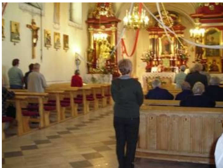
Fot. 4. i Fot. 5. Kościół Parafialny p.w. św. Jakuba w Gieble i jego wnętrze.