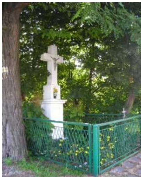
Fot. 8. Kapliczka przy ulicy Częstochowskiej