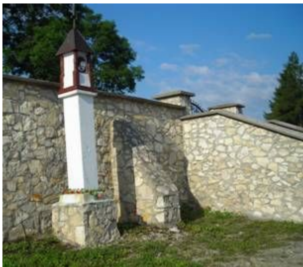
Fot. 7. Przydrożna kapliczka przy cmentarzu