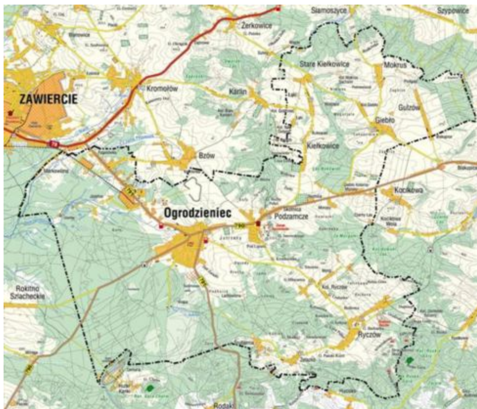
Fot.1. Mapa Gminy Ogródzieniec

W odniesieniu do pozostałych miejscowości Gminy Ogródzieniec liczba ludności w sołectwie Giebło przedstawiona jest w tabl.1.