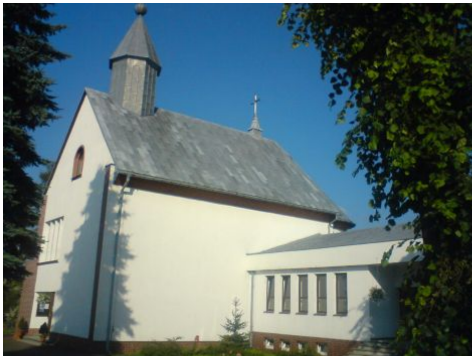
Fot2. Kościół w Ryczowie pod wezwaniem Nawiedzenia Najświętszej Marii Panny

Przy ul. Armii Krajowej położony jest Kościół Parafalny pod wezwaniem Nawiedzenia Najświętszej Marii Panny wybudowany przez mieszkańców w 1972r. Do ryczowskiej parafii przynależą sołectwa Żelazko i Kolonia Ryczów. Przy ulicy Ogrodzienieckiej znajduje się wybudowany w 1976r. cmentarz komunalny.