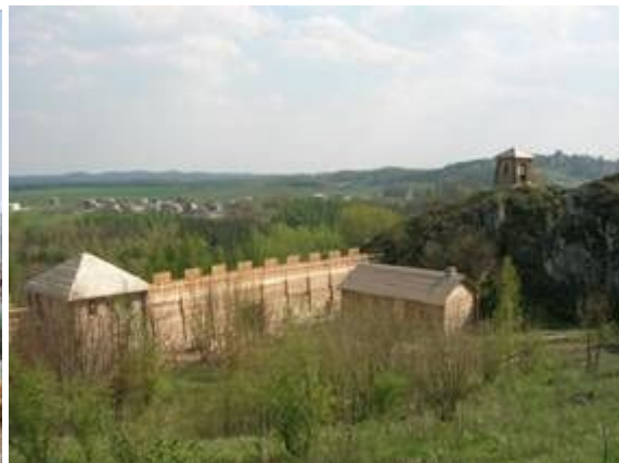
Fot. 5. Ruiny Zamku Ogrodzieniec w Podzamczu. Fot. 6. Rekonstrukcja Grodu Królewskiego na Górze Birów w Podzamczu.