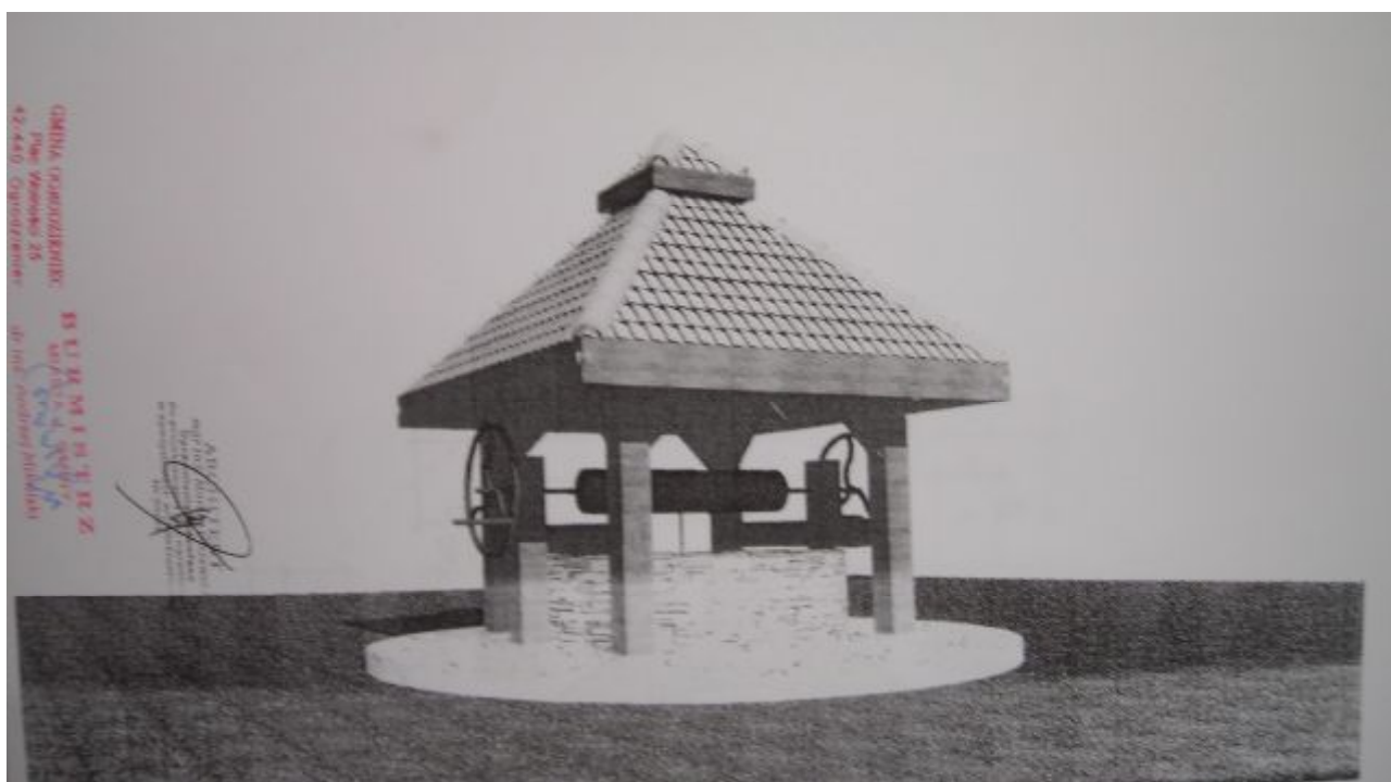
Fot.13. Wizualizacja odbudowy studni ryczowskiej w jurajskim stylu.