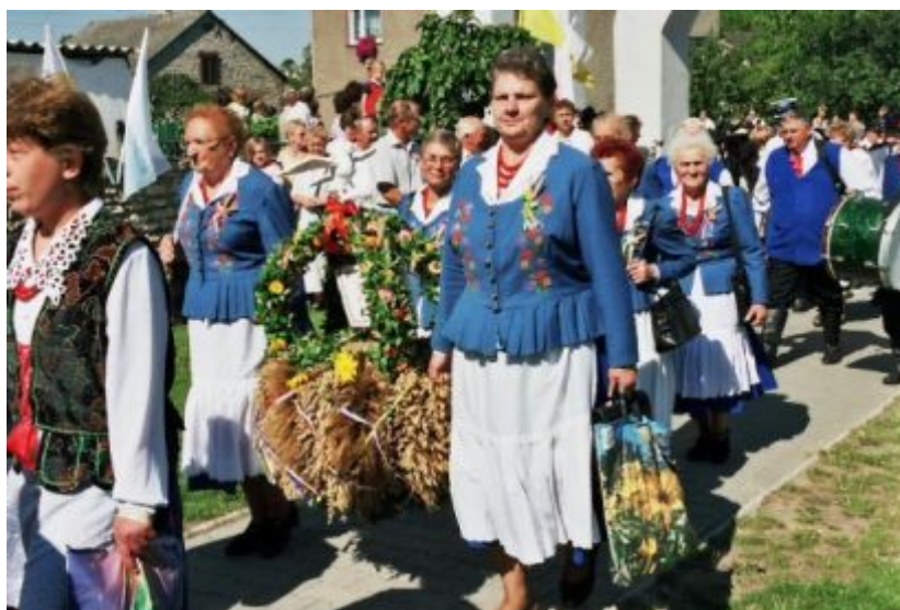
Fot.9 Koło Gospodyń Wiejskich z Ryczowa podczas VI Dożynek Województwa Śląskiego w Podzamczu

W sołectwie znajdują się: Szkoła Podstawowa i remiza OSP, w których skupia się życie społeczne i kulturalne wsi. Szczególną rolę pełni remiza położona w centrum wsi wraz z przyległym terenem. Remiza została wybudowana przez mieszkańców w latach siedemdziesiątych ubiegłego wieku. Miejsce to od zawsze stanowiło miejsce wspólnych spotkań i wspólnej zabawy. W remizie swoją siedzibę mają prężnie działające od 1960 roku Koło Gospodyń Wiejskich z zespołem ludowym „Ryczowianki”, Ochotnicza Straż Pożarna oraz Orkiestra Dęta OSP. Odbywają się w niej okolicznościowe imprezy, spotkania mieszkańców, próby zespołów artystycznych. Koło Gospodyń Wiejskich podtrzymuje miejscowe tradycje, kultywuje obrzędy, przyspiewki ludowe, prezentuje charakterystyczne dla stroje dla ryczowskiego regionu.