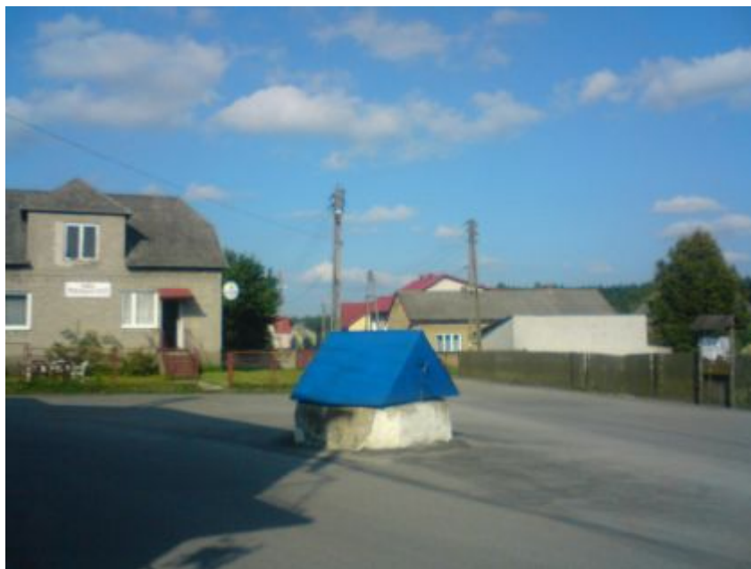
Fot.14. Studnia na ulicy Armii Krajowej, planowana do modernizacji

Zagospodarowanie terenu składać się będzie z kilku elementów funkcjonalnych: