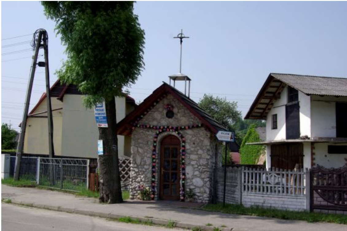
Fot.3. Kapliczka przy ul. Ogrodzienieckiej w Ryczowie

Wzdłuż ulicy Grochowieckiej i Armii Krajowej usytuowanych jest 8 studni, które obecnie nie służą już do zaopatrywania w wodę. Z uwagi na zły stan techniczny, studnie wymagają przebudowy i remontu. W 2009r. na gmina Ogrodzieniec będąca członkiem Stowarzyszenia Lokalna Grupa Działania „Perła Jury” wykonała modelową dokumentację studni na jurze.