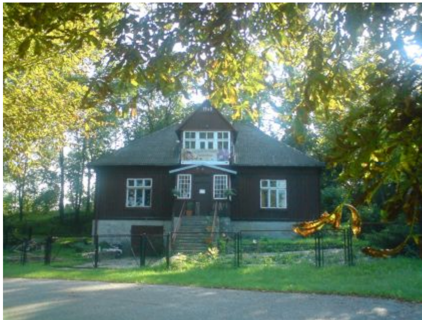
Fot.10 Budynek starej szkoły – obecnie pracownia artysty

Obok budynku remizy OSP znajduje się budynek „starej szkoły” z 1948 r., w którym odbywają się zajęcia edukacyjno - plastyczne dzieci i młodzieży prowadzone przez artystów plastyków.