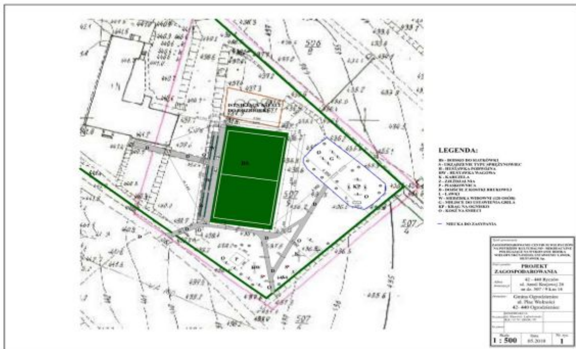
Fot.11. Projekt "Zagospodarowanie Centrum Wsi Ryczów na potrzeby kulturalno-rekreacyjne" – zagospodarowanie działki 507/9

Wykorzystanie walorów krajobrazowych i kulturowych miejscowości pozytywnie wpłynie na rozwój usług związanych z turystyką, a tym samym przyczyni się do rozwoju gospodarczego miejscowości. Dzięki realizowanym projektom przedsięwzięć odnowy wsi, wzrośnie konkurencyjność Ryczowa jako miejscowości turystycznej, przy zachowaniu jej tożsamości, odrębności, wartości duchowych i materialnych oraz charakterystycznego krajobrazu kulturowego.