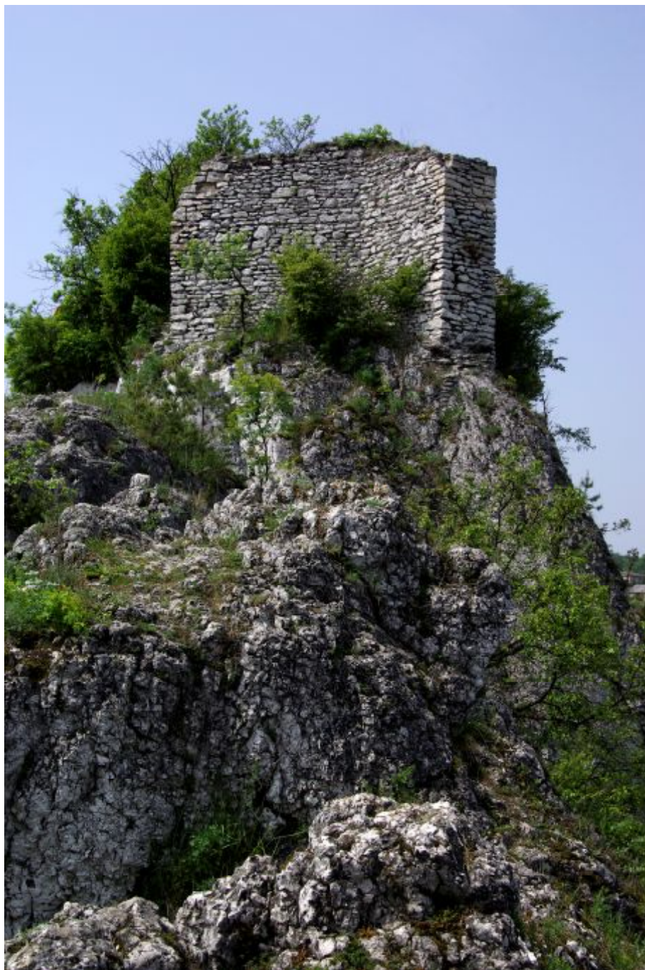
Fot.4. Zamek rycerski – ruiny strażnicy obronnej w Ryczowie