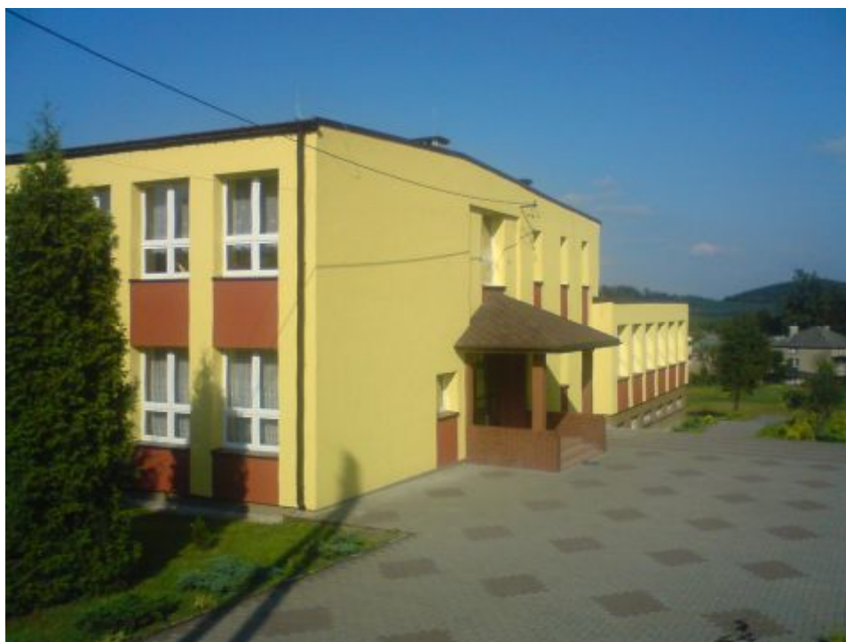
Fot.7 Szkoła Podstawowa w Ryczowie

przeprowadzono prace termomodernizacyjne, zainstalowane zostały nowoczesne gazowe kotły grzewcze oraz solary słoneczne dla przygotowania ciepłej wody użytkowej.