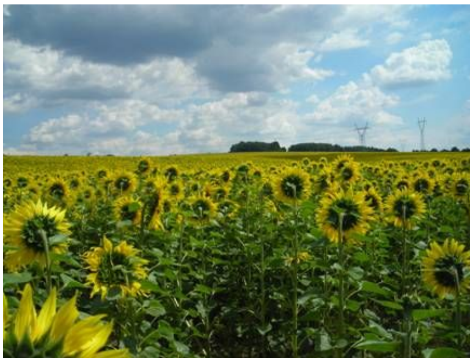
Fot. 8. Słoneczniki – pole uprawne

Warunki klimatyczne i glebowe panujące w gminie Ogrodzieniec predysponują do uprawy roślin zbożowych. Nowością wśród uprawianych roślin jest słonecznik.