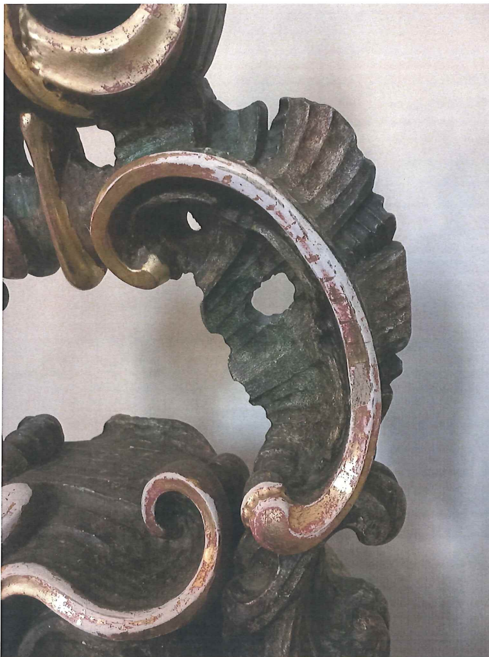
Fot.6 Górna część chrzcielnicy. Stan zachowania obiektu przed konserwacją. Widoczne przetarcia na ornamentach nakrywy ukazujące czerwony pulment oraz białą zaprawę.