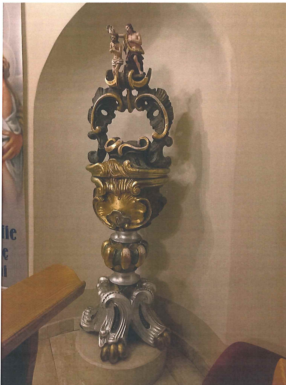
Fot.2 Chrzcielnica, widok ogólny. Stan zachowania obiektu przed konserwacją.