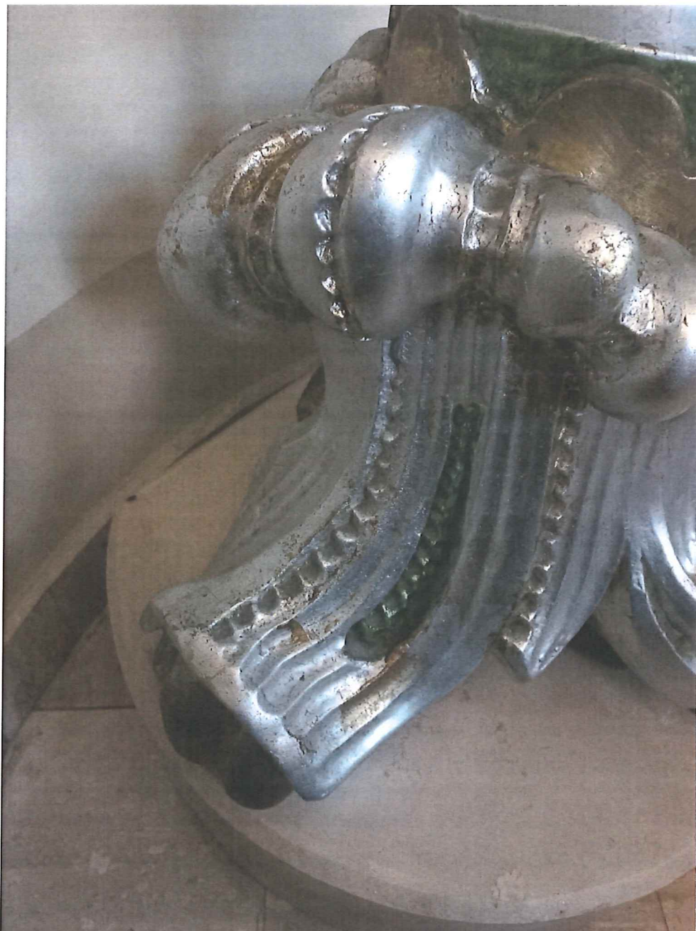
Fot.9 Podstawa chrzcielnicy. Stan zachowania obiektu przed konserwacją. Widoczne powierzchniowe uszkodzenia, przebarwienia i zarysowania.