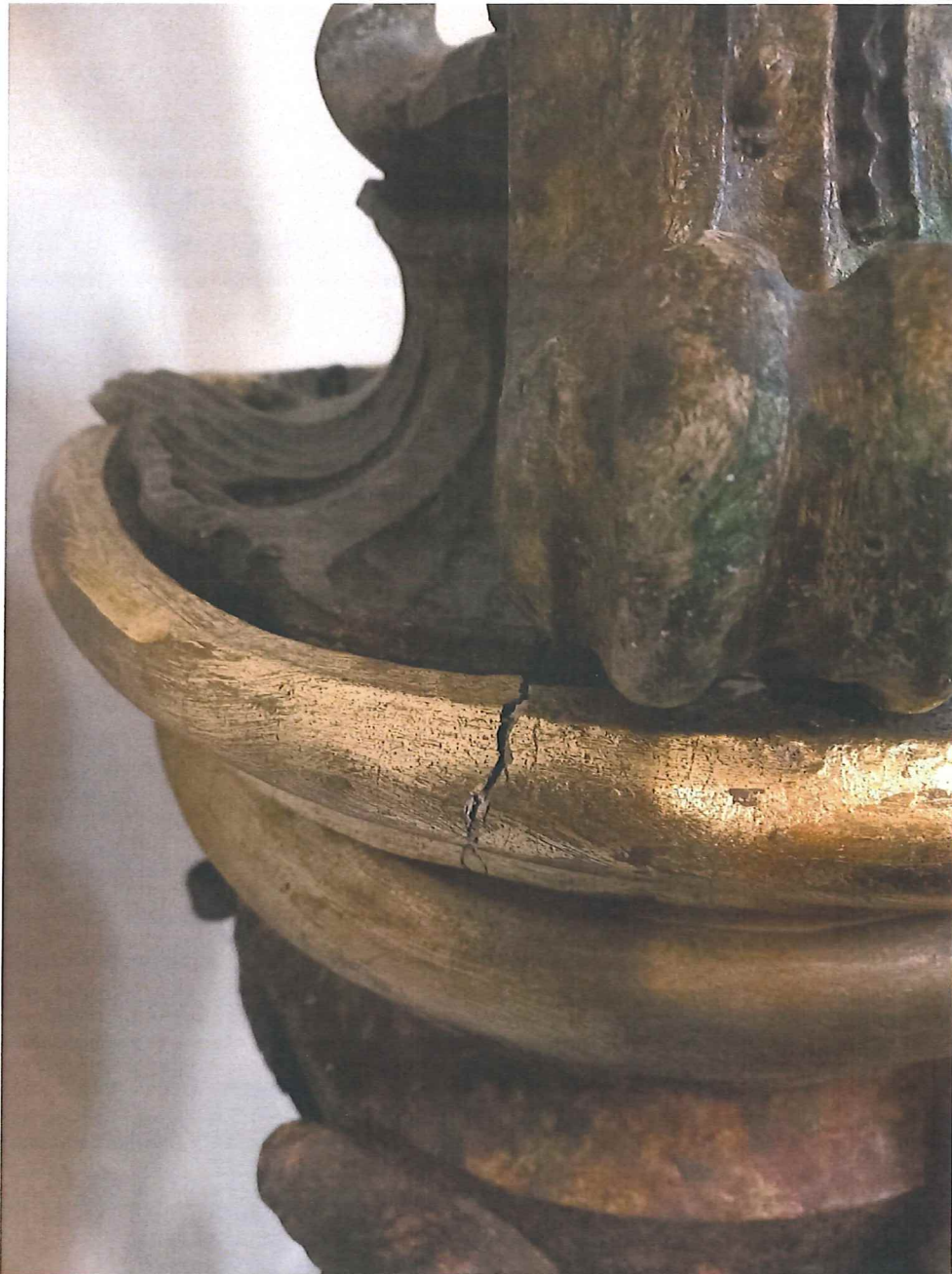
Fot.7 Górna część chrzcielnicy. Stan zachowania obiektu przed konserwacją. Widoczne pęknięcie struktury drewna i nawasrtwień.