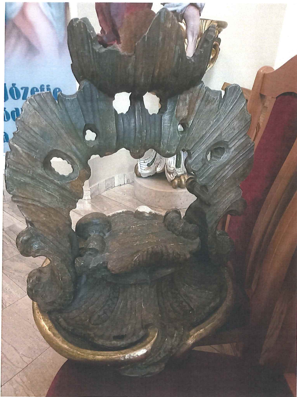
Fot.10 Górna część chrzelnicy, odwrocie. Stan zachowania obiektu przed konserwacją.