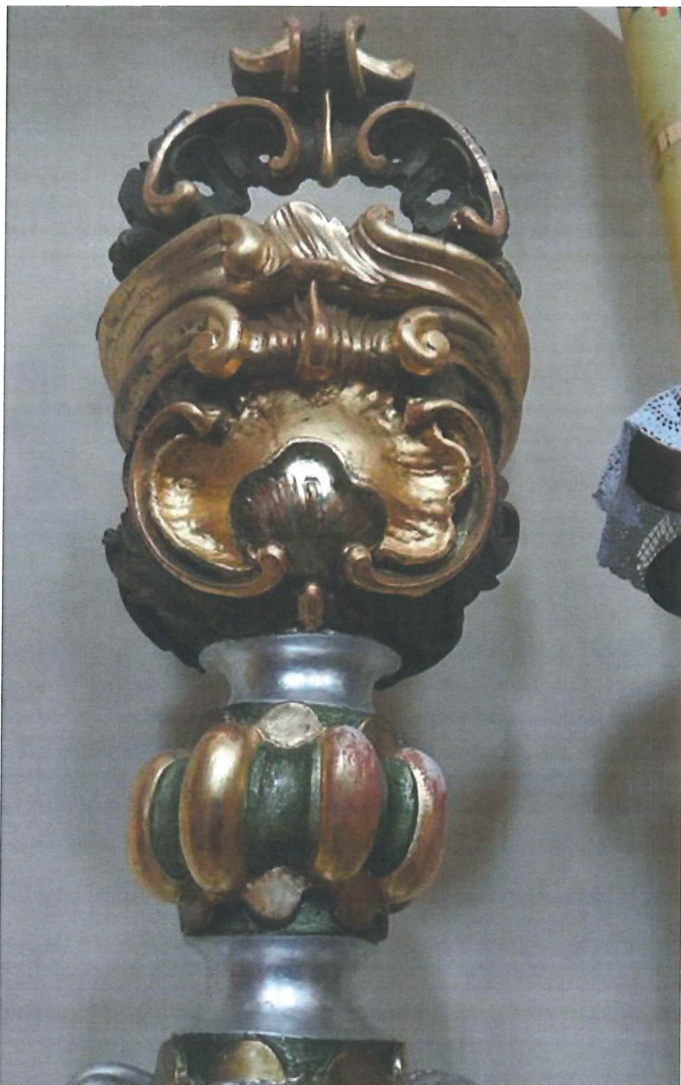
Fot.3 Górna część chrzcielnicy. Stan zachowania obiektu przed konserwacją. Widoczne przetarcia na nodusie ukazujące czerwony pulment oraz białą zaprawę.