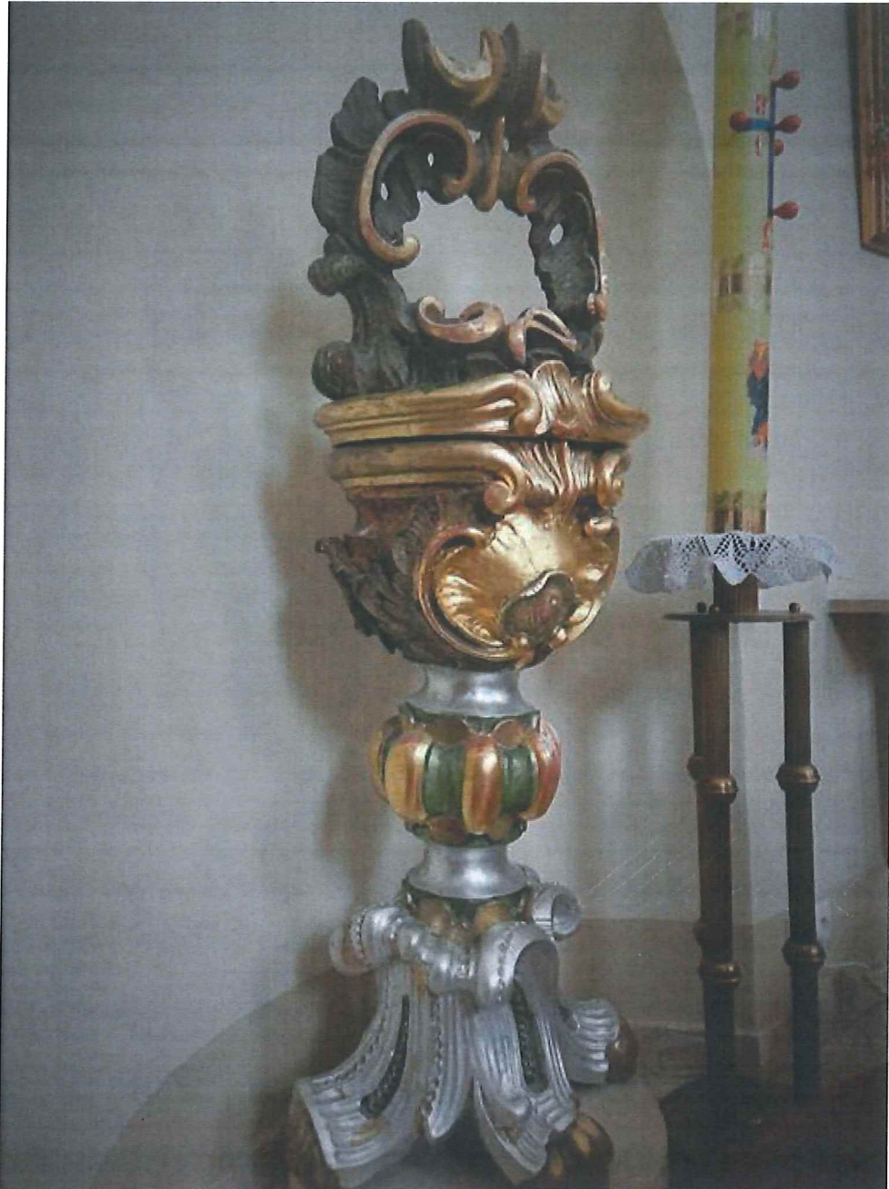
Fot.1 Chrzcielnica, widok ogólny. Stan zachowania obiektu przed konserwacją.