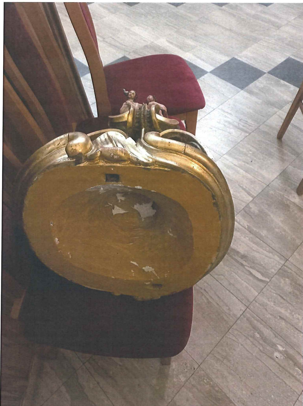
Fot.8 Nakrywa chrzcielnicy. Stan zachowania obiektu przed konserwacją. Widoczne łuszczące się płyty farby.