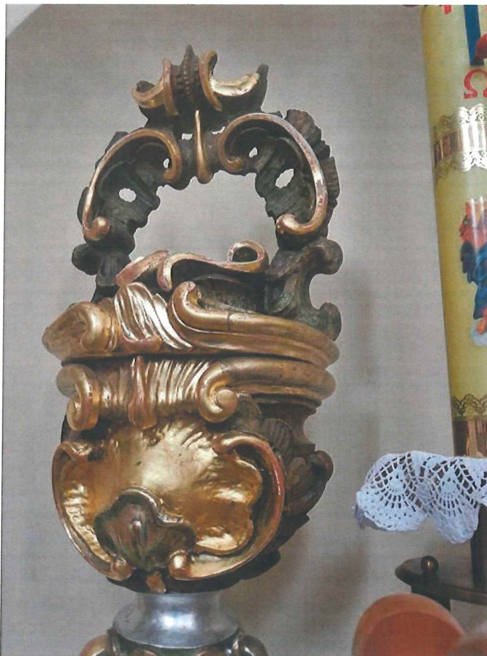
Fot.4 Górna część chrzcielnicy. Stan zachowania obiektu przed konserwacją. Widoczne przetarcia na ornamencie nakrywy ukazujące czerwony pulment oraz białą zaprawę.