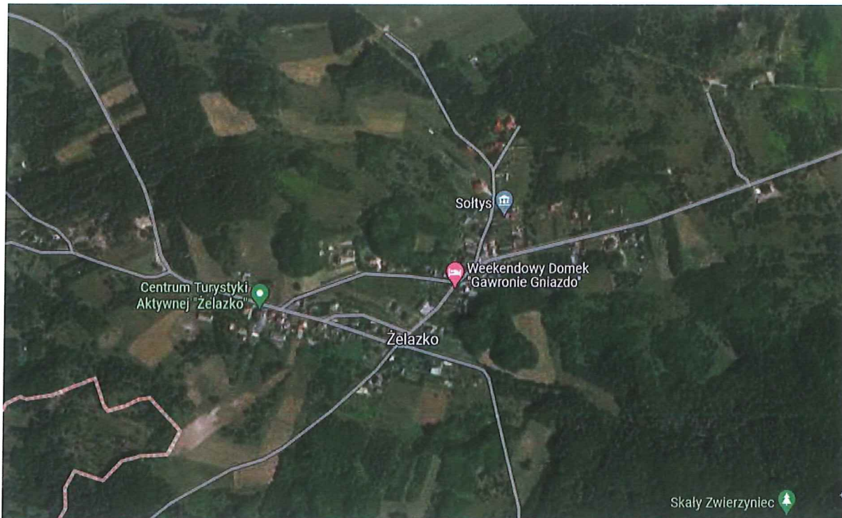
Fot. 1. Mapa miejscowości Żelazko