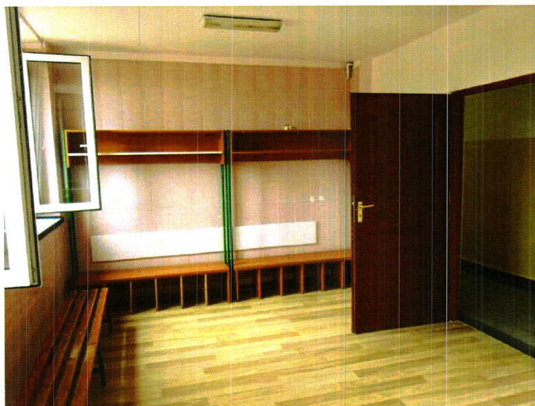
Zdjęcie nr 5. Szatnia przy sali gimnastycznej