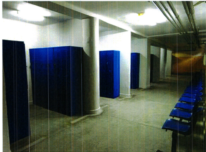
Zdjęcie nr 2. Szatnie