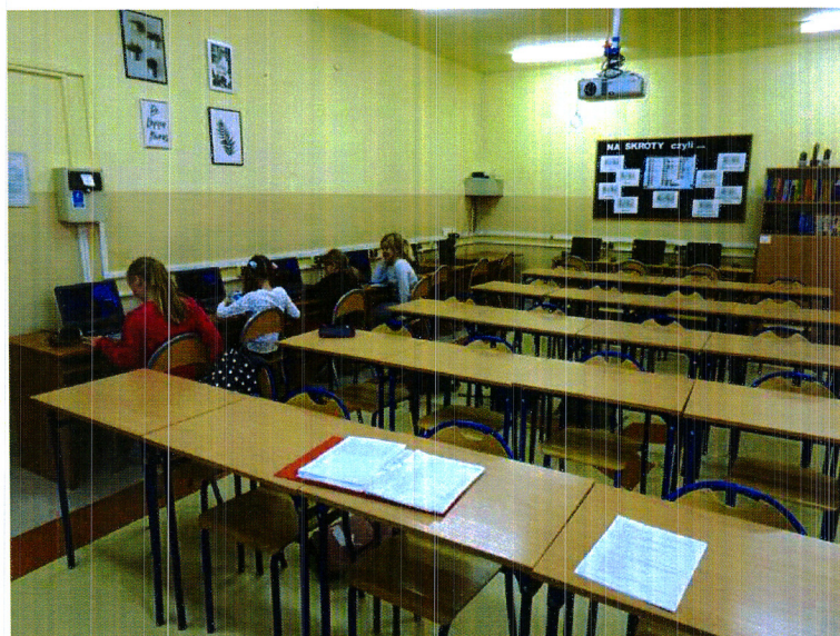
Zdjęcie nr 6. Sala lekcyjna