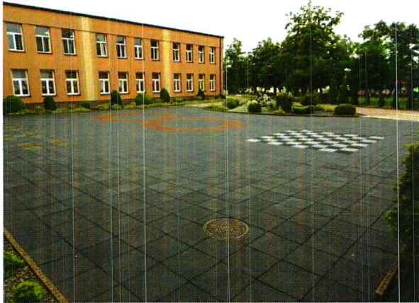
Zdjęcie nr 1. Wewnętrzny dziedziniec szkoły