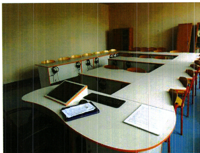
Zdjęcie nr 7. Laboratorium językowe