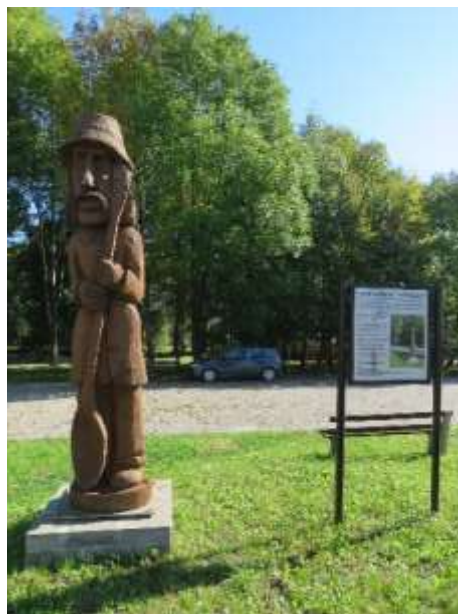
Ryc. 23 Giebło – rzeźba dziada giebelskiego

Na terenie gminy działają stowarzyszenia oraz fundacje m.in. Fundacja Wspierania Aktywności Twórczej i Regionalnej „Stara Szkoła”.