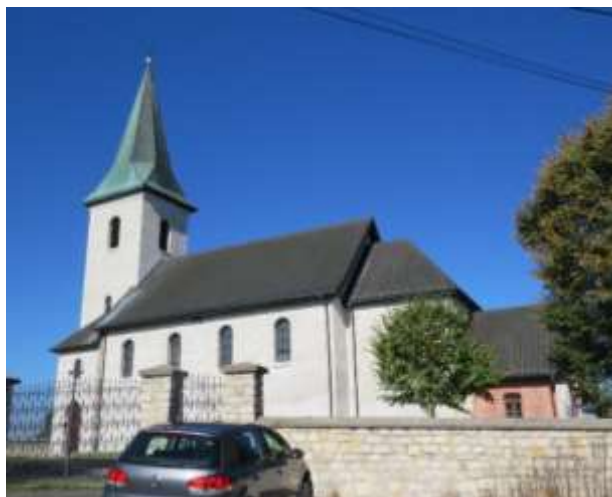
Ryc. 7 Kościół w Gieble

Najcenniejszy obiekt sakralny znajduje się w Gieble, to romański kościół pod wezwaniem św. Jakuba z XIII wieku. Budowla przebudowana w latach 1900-1912. Wówczas nieznacznie podwyższono część nawy i prezbiterium, dobudowano zakrystię oraz postawiono nową wieżę (pierwotna wraz z romańskim chórem została zburzona). Kościół został także nieco przedłużony. Obecnie pierwotnie jednonawowy kościół, murowany z kamienia, posiada od wschodu mniejsze zamknięte prosto prezbiterium, z dobudowaną z cegły zakrystią. Od zachodu wieża z kruchtą. Elewacje surowe, proste, rozcłonkowane jedynie rytmem okien zamkniętych półkoliście. W elewacji południowej relikty romańskiego portalu. Prezbiterium przekryte sklepieniem krzyżowym, w nawie strop z tynkowaną podsufitką dekorowaną malowidłami. Kościół jest otoczony murem kamiennym zbudowanym w 1787 roku. Obiekt poddany pracom remontowym i konserwatorskim.