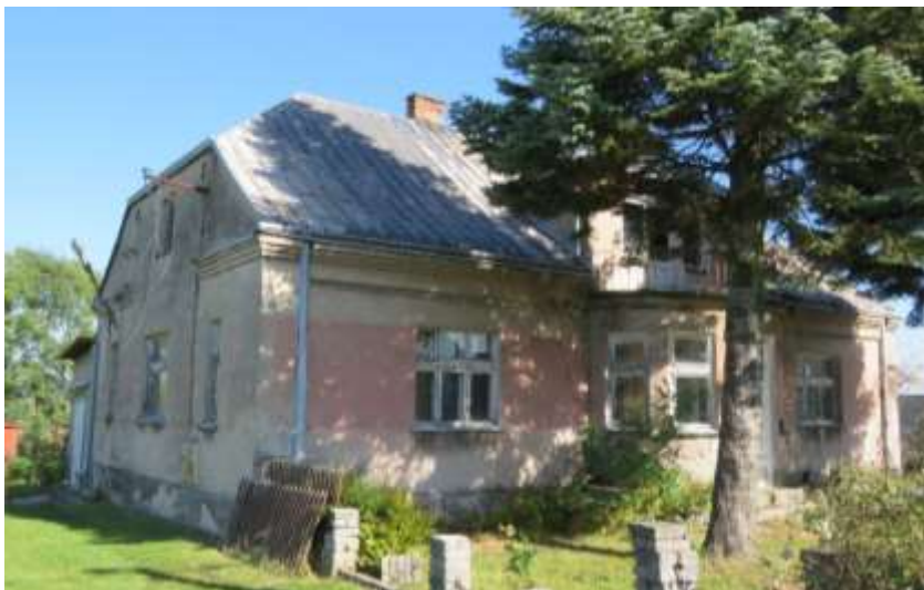
Ryc. 13 Gieble, dawna plebania przy ul. Częstochowskiej

Pozostałe interesujące obiekty mieszkalne w Ogrodzieńcu to dawna willa dyrektora cegielni przy ul. Orzeszkowej. Do obiektów posiadających wartości historyczne należy także zaliczyć dawną plebanię w Gieble wraz z ogrodzeniem i stodołą oraz plebanię w Ogrodzieńcu. Przy czym obydwie domy są zagrożone utratą wartości zabytkowych, w przypadku