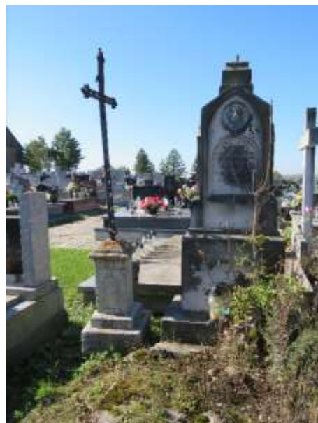
Ryc. 11 Relikty zabytkowych nagrobków na cmentarzu w Gieble

Jednym z nielicznych obiektów rezydencjonalnych gminy jest dworek szlachecki w Gieble. Nie jest znana dokładna data jego budowy ani nazwisko architekta. Według danych historycznych przed wojną jego dzierżawcami byli państwo Niedzielscy. Obecny budynek wybudowany został na przełomie XIX i XX wieku, najprawdopodobniej w miejscu wcześniejszego, drewnianego dworu. Dworek położony jest w parku w sąsiedztwie stawu. Wybudowany z kamienia, tynkowany, kryty dachem dwuspadowym od frontu z dwoma wydatnymi ryzalitami, przechodzącymi w partii dachu w szczytowe wystawki. Obiekt po częściowo wykonanych pracach remontowych (wymieniony dach, stolarka), wskazane prace przy elewacjach w celu przywrócenia właściwego stanu technicznego i estetycznego.