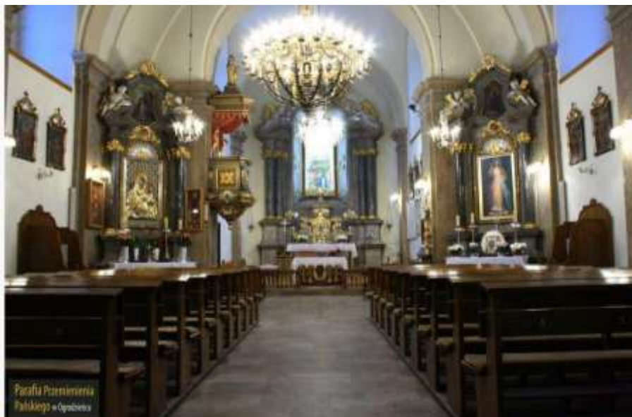
Ryc. 18 Wnętrze kościoła parafialnego w Ogrodziencu; źródło: http://www.parafia.ogrodzieniec.pl/kategorie/wnetrze_kosciola#!lightbox[roadtrip]/15/