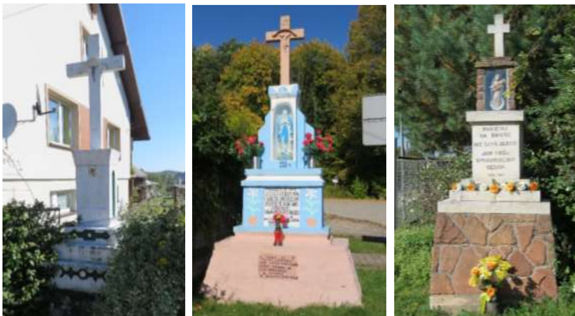
Ryc. 20 Przydrożne krzyże w Ryczowie, Gieble oraz Gieble Kolonii