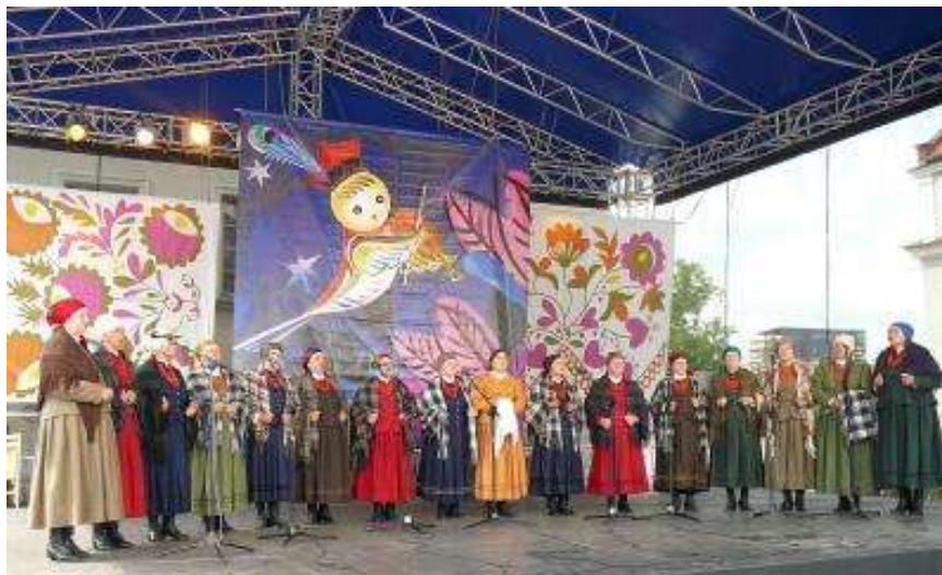
Ryc. 22 Zespół Folklorystyczny Koła Gospodyń Wiejskich z Kolonii Ryczów

W sposób szczególny działania związane z dziedzictwem niematerialnym są realizowane w Ryczowie, którego mieszkańcy m.in. zajmują się rękodziełem artystycznym, szydełkowaniem, haftem. W sołectwie funkcjonują: Koło Gospodyń Wiejskich, które co roku bierze udział w uroczystościach dożynkowych przygotowując wieniec ze zbóż i plonów. Z koła wywodzi się Zespół „Ryczowianki”, który stale dba o kultywowanie rodzimych tradycji ludowych, co odzwierciedla się w repertuarze, w którym znajdują się: pieśni i przyśpiewki, obrzędy m.in.: Darcie pierza, Wieczór Andrzejkowy, Pustocha. Zespół uczestniczy także w wydarzeniach muzycznych poza gminą np. w 2020 roku w Jurajskim Festiwalu Kolęd i Pastorałek.