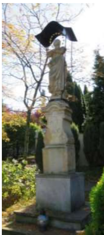
Ryc. 19 Figura Matki Boskiej NP. w Ogrodziencu, fot. I. Solisz

Należy zaznaczyć, że poza wyżej wymienionymi zabytkami ruchomymi na terenie gminy odnaleźć można zabytki kultu – figury świętych i kapliczki. Szczególnie warto zwrócić uwagę na figurę Matki Boskiej Niepokalanego Poczęcia, ustawioną na wysokim postumencie w sąsiedztwie kościoła parafialnego. Kamienna figura Maryi w stylistyce barokowej pochodzi z 1806 roku. Pełnoplastyczna rzeźba ustawiona jest na wysokim cokole ujętym w miękkie profile i woluty, postać Maryi w lekkim kontrapoście ustawiona na kuli ziemskiej, depta stopą głowę węża. Nad ramionami i głową zamontowany został podczas prac konserwatorskich baldachim. Inne barokowe rzeźby kamienne w Ogrodziencu to figury św. Wawrzyńca i św. Floriana ustawione w niszach fasady kościoła, rzeźby św. Jana Nepomucena, jedna ustawiona na ogrodzeniu kościoła od ul. Kościuszki, druga na skwerze, u zbiegu ulic Kościuszki i Narutowicza.