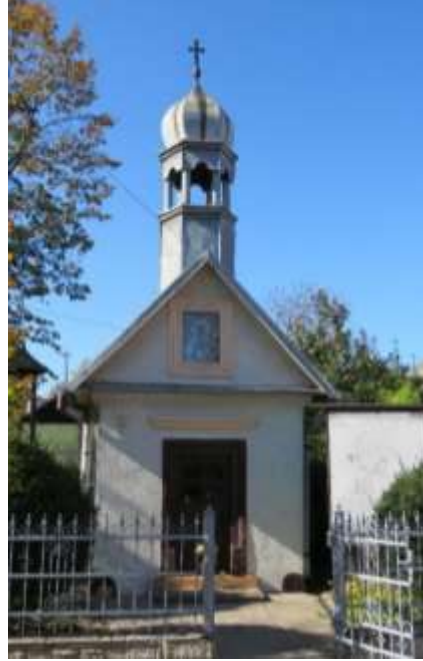
Ryc. 9 Kapliczka pw. św. Floriana przy ul. Olkuskiej; Ryc. 10 Kapliczka przy ul. Zamkowej w Podzamczu

Kapliczka pw. Św. Floriana w Ogrodzieńcu została wybudowana w 1920 roku z inicjatywy mieszkańców, fakt ten upamiętniony jest na tablicy umieszczonej w szczycie pomiędzy okienkami. Całość budowli utrzymana jest w stylu neogotyckim. Kapliczka na rzucie zbliżonym do kwadratu, murowana z cegły z ostrołucznie zamkniętymi otworami drzwiowym, okiennymi i wnękami, w fasadzie szczyt trójkątny z dekoracyjnym fryzmem w narożnikach podkreślony przez sterczyny. W dwuspadowym dachu sygnaturka zwieńczona ostrosłupowym daszkiem z kulą i krzyżem.