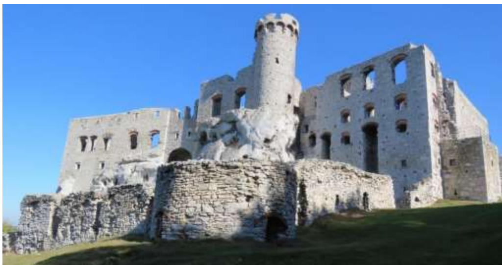
Ryc. 6 Zamek Ogrodzieniec w Podzamczu

Najstarszym, XV-wiecznym elementem zamku jest jednotraktowe skrzydło północno-wschodnie, pierwotnie jedno- bądź dwukondygnacyjne, z zachowanymi w przyziemiu tzw. sklepieniami hajduckimi z XVI w. bądź XVII w. Powstałe w okresie późnego średniowiecza skrzydło północno-zachodnie wzniesiono na planie nieregularnego czworoboku. Charakterystyczna, ulokowana na stoku zbocza kilkukondygnacyjna Kurza Stopa odznacza się zachowanymi wąskimi strzelnicami kluczowymi w przyziemiu.