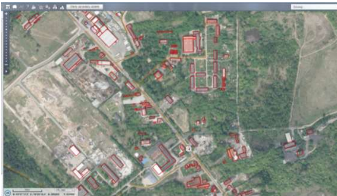
Ryc. 26 Czytelny sposób zagospodarowania przestrzeni w obszarze dawnego zespołu zabudowy Cementowni WIEK, problemem jest brak opracowań dotyczących historii i zagospodarowania terenów, źródło mapy: https://polska.e-mapa.net

wartościowanie zachowanych elementów dawnego założenia (jako kompleksowy zespół nie tylko budynków przemysłowych, ale także zasobów mieszkaniowych i towarzyszącej infrastruktury społecznej) ze wskazaniem najcenniejszych elementów, które będą wskazane do objęcia ochroną konserwatorską.