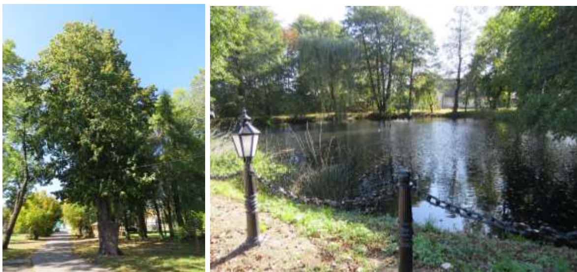
Ryc. 17 Park podworski w Gieble

Ochrona konserwatorska wskazana w ustawie o ochronie zabytków i opiece nad zabytkami dotyczy parków, ogrodów i innych form zaprojektowanej zieleni. Takich form zaprojektowanej zieleni objętej wpisem do rejestru na terenie gminy nie ma. Natomiast w ewidencji zabytków znajdują się dwa parki: podworski w Gieble oraz park w Ogrodzieńcu przy dawnej cementowni (założenie parkowe z XX wieku, w stanie dobrym).