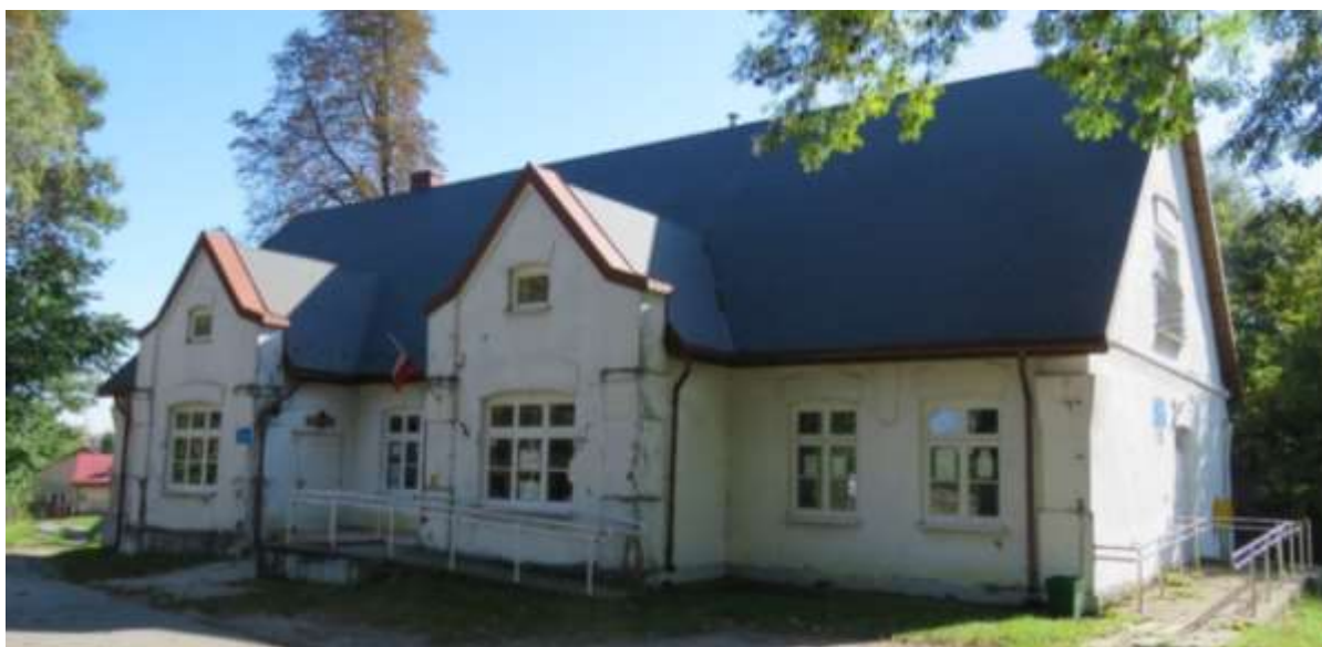
Ryc. 12 Dworek szlachecki w Gieble