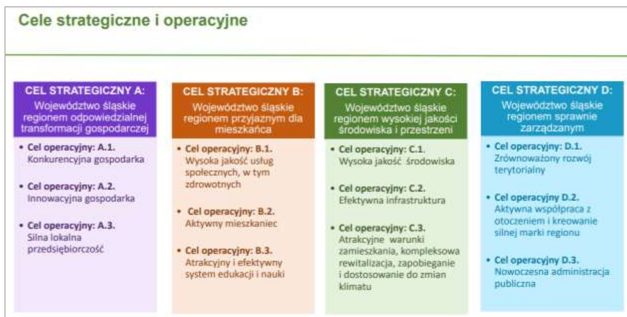
Ryc. 1

Strategia „Śląskie 2030” odpowiada również na wyzwania demograficzne stojące przed województwem śląskim oraz związane z poprawą warunków życia w regionie, zarówno dla jego obecnych, jak i przyszłych mieszkańców. Realizacja zapisów strategicznych składających się na wspomnianą wizję będzie wymagała zaangażowania licznych podmiotów sceny regionalnej.