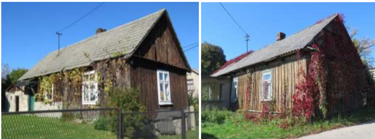
Ryc. 14 Ryczów, domy przy ul. Grochowieckiej i Ogrodzienieckiej, fot. I. Solisz

Na terenie gminy zachowały się także przykłady regionalnego budownictwa drewnianego, to głównie domy mieszkalne, w których niewielka część gospodarcza jest murowana. Ich największe skupisko znajduje się we wsi Ryczów. Parterowe, niewielkie budynki w większości są ustawione szczytem do drogi, zbudowane w konstrukcji zrębowej, szalowane są deskami, nakryte dachami dwuspadowymi; w ścianie szczytowej mają jedno, ewentualnie dwa okna. Wiejskim budynkom mieszkalnym towarzyszą obiekty gospodarcze związane z produkcją rolną, jednak nie posiadają one szczególnej wartości zabytkowej.