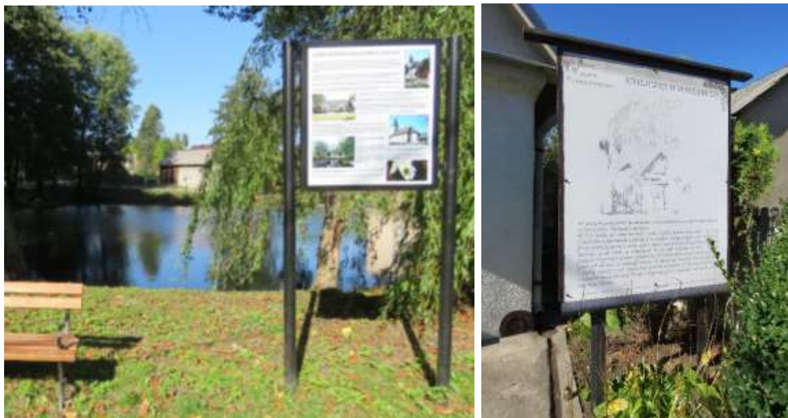
Ryc. 24 Giebło, tablica na terenie parku podworskiego opisująca historię miejscowości i najważniejsze zabytki, fot. I. Solisz; Ryc. 25 Podzamcze, tablica informacyjna o zabytkowej kapliczce przy ul. Zamkowej, obecnie mało czytelna, fot. I. Solisz

dopracowany w całej gminie, a ze względu na turystyczną działalność gminy wskazane jest stałe monitorowanie tablic informacyjnych i drogowych oraz poszukiwanie nowych form przekazywania interesujących dla turystów informacji np. z wykorzystaniem kodów QR.