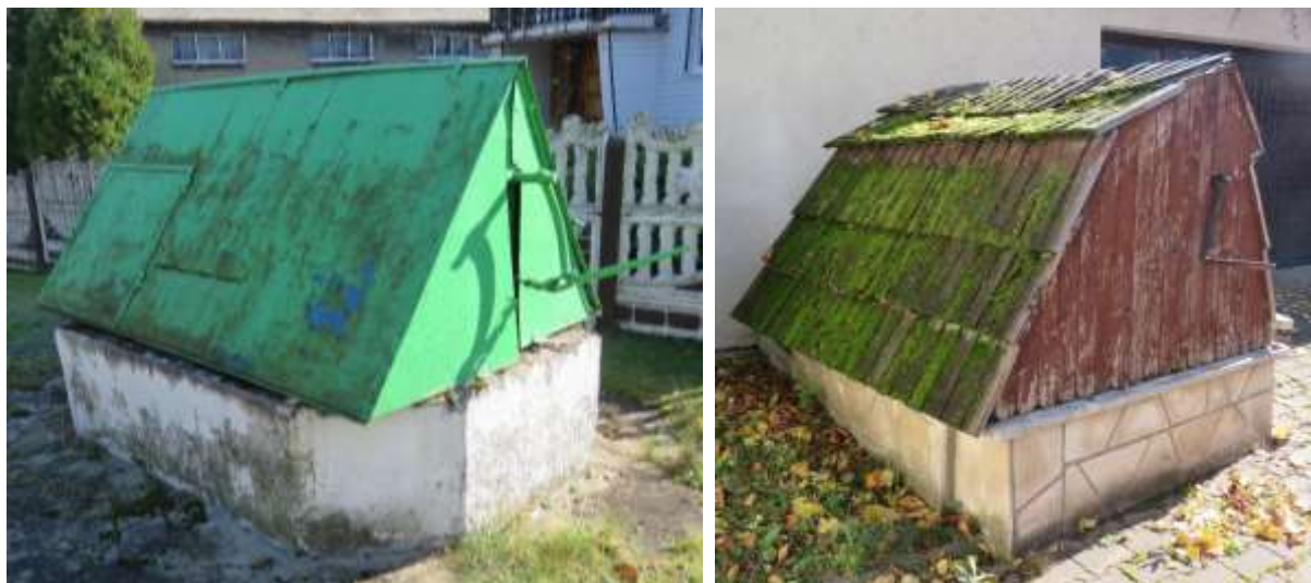
Ryc. 15, Ryczów, studnia przy ul. Grochowieckiej, fot. I. Solisz, Ryc. 16 Ogrodzieniec, studnia przy zabudowaniach plebanii, fot. I. Solisz

dostęp do wody mieszkańcom miejscowości. Dwie XIX – wieczne studnie z dwukołowymi kołowrotkami znajdują się w Gieble, dwie studnie w Mokrusach mają karbowane kołowroty, są nakryte dodatkowym zadaszaniem, wspartym na słupkach, pozostałe studnie są skromniejsze. Część z nich była modernizowana na przestrzeni lat i ma obecnie murowane lub betonowe cembrowiny, nakryte zadaszaniem z blachy, pierwotnie daszki te były drewniane, możliwe, że kryte gontem, analogicznie jak studnia na terenie przykościelnym w Ogrodzieńcu.