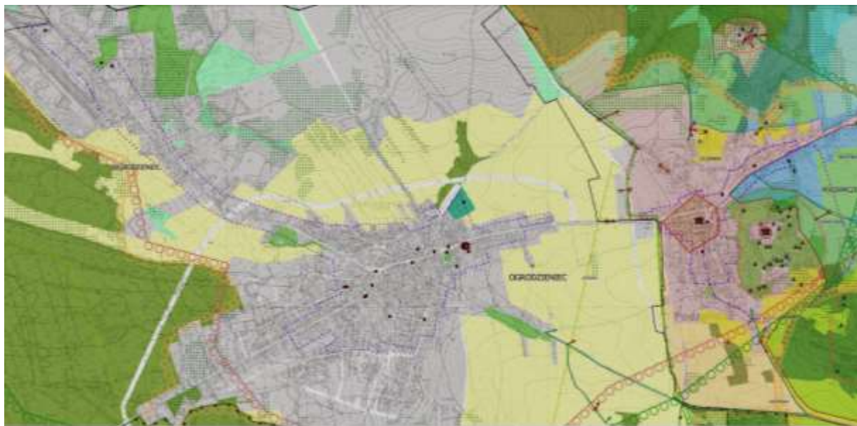
Ryc. 3 Rysunek studium – fragment zawierający informacje dotyczące ochrony dziedzictwa kulturowego, m.in. wyznaczone strefy ochrony konserwatorskiej (przerywana linia fioletowa) czy lokalizację zabytków

Strefy „WA” i „WB” wyznaczone w studium dotyczą realizowania działalności inwestycyjnej w obrębie stanowisk archeologicznych oraz w wyznaczonych strefach ochronnych.