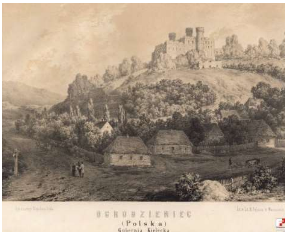
Ryc. 5 Zamek Ogrodzieniec, rysunek Napoleon Orda, 1862r.

Zniszczone w wyniku pożaru założenie zastąpiono na przełomie XV i XVI w. budowlą murowaną, usytuowaną na skale w miejscu skrzydła wschodniego, rozbudowaną o partię południową, mur z basztą południową oraz nieznaną formą obronną w miejscu obecnej Baszty Kredencarskiej. Pierwszymi znanymi właścicielami zamku byli Włodkowie herbu Sulima, którzy w XV w. rozbudowali zamek. W latach 1533-1547 z inicjatywy Seweryna Bonera średnio-wieczną warownię przebudowano na renesansową rezydencję, były to lata świetności założenia. Po rodzinie Bonerów, kolejnym włodarzem zamku był Jan Firlej, następnie jego syn Mikołaj. W 1587 roku zamek został zdobyty i częściowo zniszczony przez oddziały arcyksięcia Maksymiliana Habsburga. W 1655r. zamek padł łupem Szwedów, którzy go okradli i spalili. W 1669r. Stanisław Warszycki częściowo odbudował zamek i wyremontował. W 1702 roku zamek został ponownie obrabowany i spalony przez Szwedów. Następowaly kolejne zmiany właścicieli. Powołane w 1906 r. z inicjatywy znanego podróżnika i geografę Aleksandra Janowskiego, Polskie Towarzystwo Krajoznawcze spopularyzowało ruiny ogrodzienieckiego zamku i przyczyniło się do podjęcia działań ratowania pozostałości zamku.