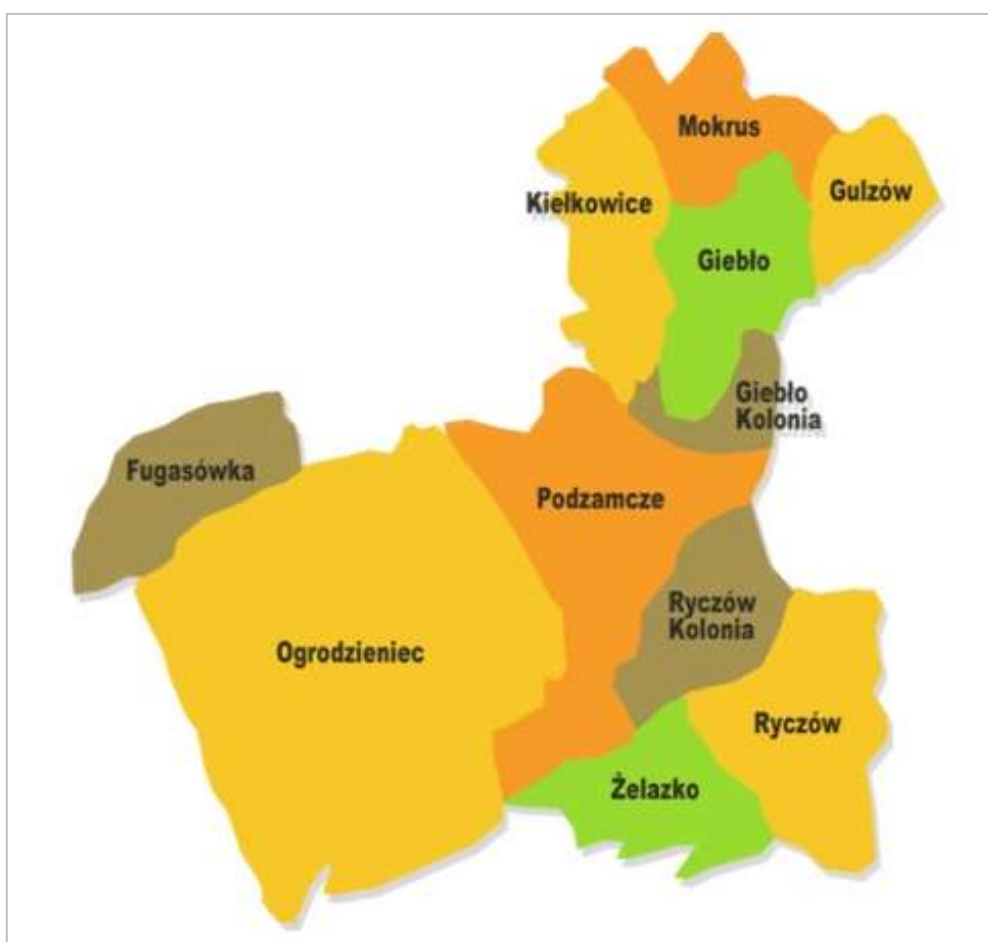
Ryc. 4. Miejscowości Gminy Ogródzieniec

ówczesnej stolicy kraju i strzegący szlaków handlowych, mających istotny wpływ na rozwój sieci osadniczej. W XIII wieku istniał obwarowany gród na Górze Birów, który został zniszczony w trakcie wojen polsko-czeskich i później już nieodbudowany. Od tego czasu pojawiają się umocnienia na przeciwległej Górze Zamkowej. W czasach Kazimierza Wielkiego (XIV w.) wybudowano lub rozbudowano zamki Ogródzieniec oraz w Ojcowie, Pieskowej Skale, Żarnowcu, Bydlinie, Smoleniu, Rabsztynie tworząc system obronny, zabezpieczający ówczesną granicę od strony Śląska, który był uzależniony od wpływów czeskich. Proces zasiedlania terenu i powstanie najstarszych elementów dzisiejszej sieci osadniczej rozpoczął się już w XIV wieku. W czasach nowożytnych powstały przysiółki i niewielkie osady folwarczne. Ostateczny i współczesny układ sieci osadniczej uformowany został na przełomie XIX i XX wieku, kiedy to, w wyniku parcelacji wielkich majątków i komasacji, powstały zespoły osadnicze Kolonia Ryczów, Kolonia Giebło, Morusy, Więcki, czy też skupiska zabudowy rozproszonej w różnych zespołach osadniczych. W XIX wieku oraz na początku XX wieku ukształtował się zespół zabudowy przemysłowej zlokalizowany w północno-zachodniej części Ogródzieńca 2 .