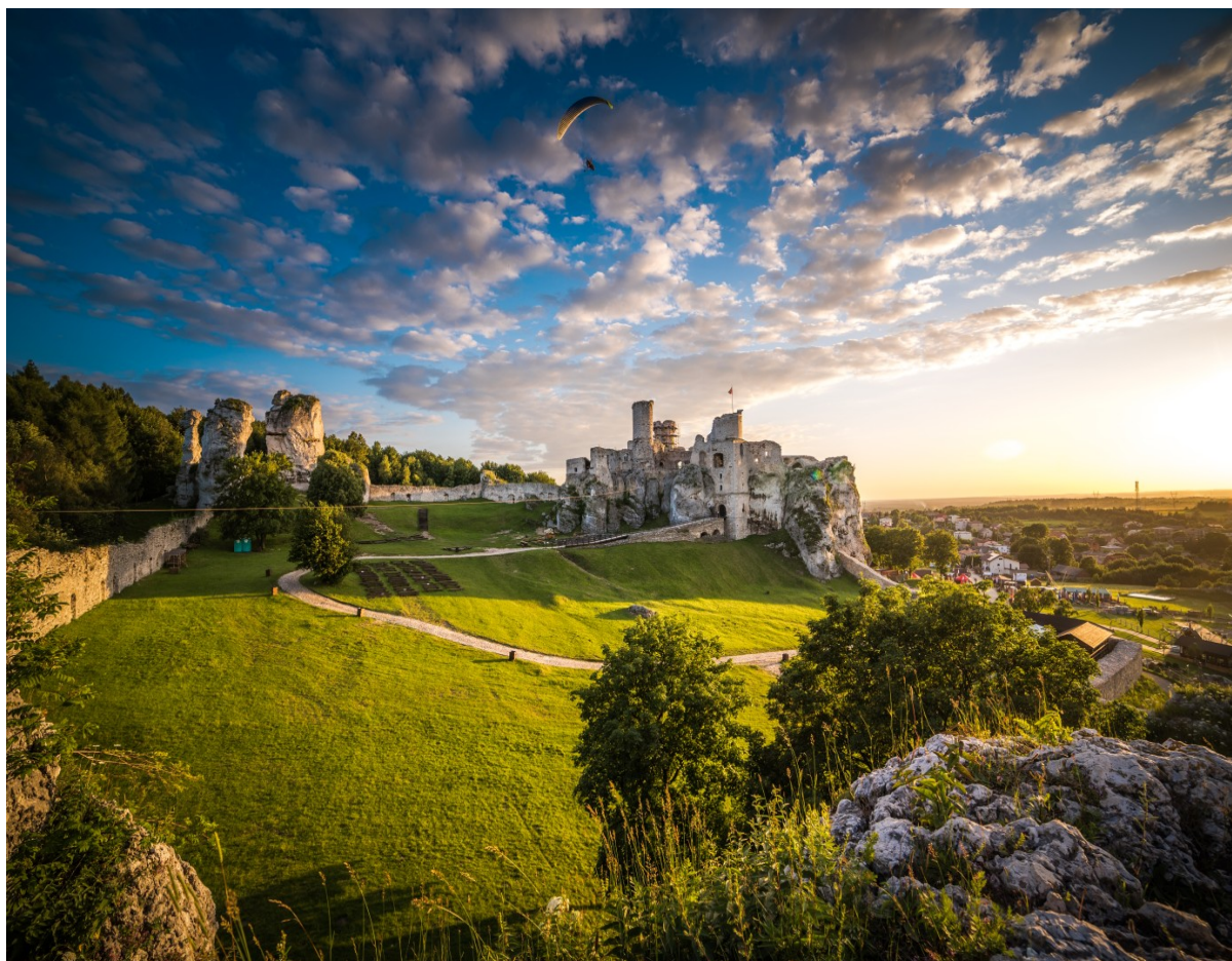
Ruiny Zamku Ogrodzieniec w Podzamczu

się w bastionie. W czasie konserwacji wybudowano w niej kręcone schody. Piątej baszty niestety nie ma, ale istnieją dowody na to, że baszta ta istniała. Píše o niej Michał Poleski w książce Pt. „Zamek Ogrodzieniecki na tle najbliższej okolicy, jego przeszłość i dzień dzisiejszy”: od strony północnej dochowało się podmurowanie kwadratowe, na którego rogu wschodnim dokładnie rysują się ślady zrujnowanej baszty. Na istniejącej jeszcze przed I wojną światową akwareli malarza Gumińskiego, widać zarys wszystkich baszt.