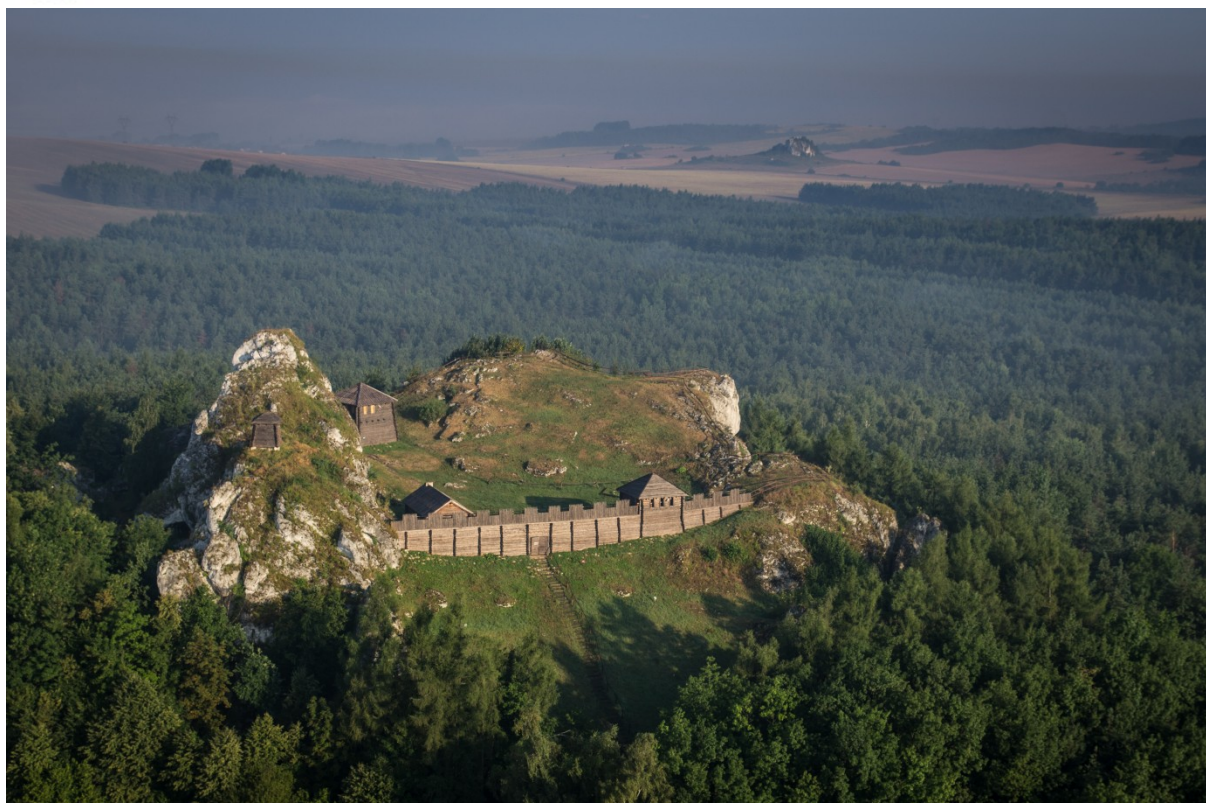
Gród Królewski na Górze Birów