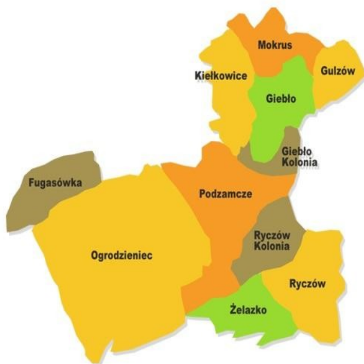
Fot. 2. Mapa Gminy Ogrodzieniec z wyszczególnieniem miejscowości Podzamcze.