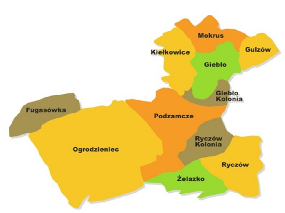
Fot. 1. Mapa Gminy Ogrodzieniec z wyszczególnieniem sołectwa Kielkowice.