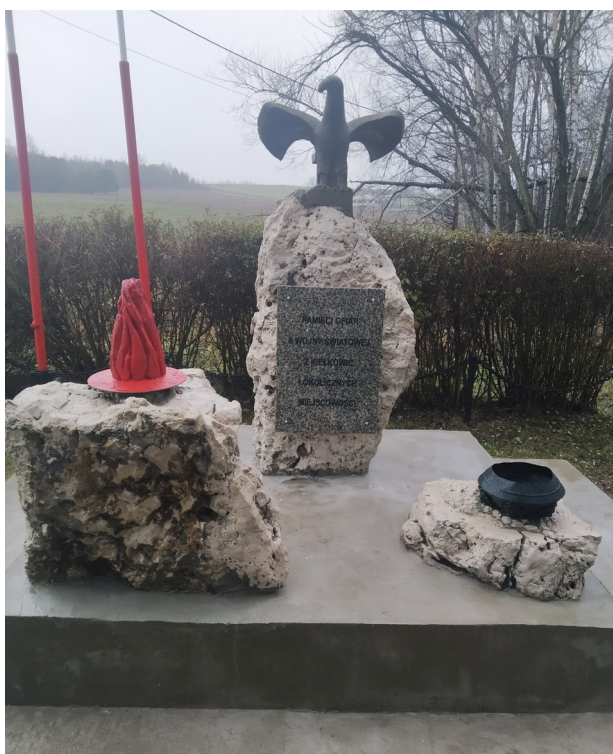
Pomnik ku czci członków Ruchu Oporu pomordowanych w czasie II wojny światowej” stoi przy ul. Turystycznej w Kiełkowicach.