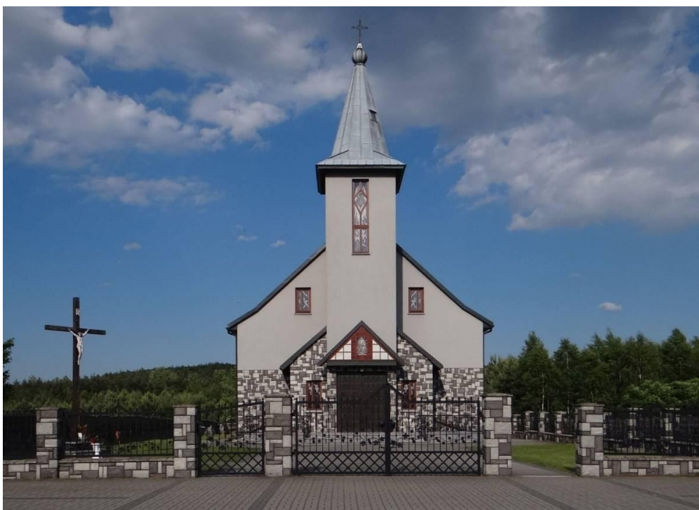
Kaplica pod wezwaniem Miłosierdzia Bożego, należącej do Parafii Rzymskokatolickiej w Gieble