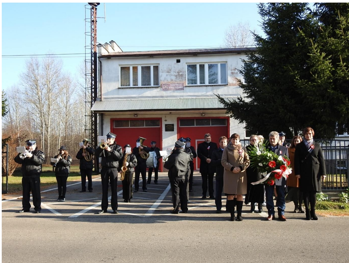
Remiza OSP w Kiełkowicach