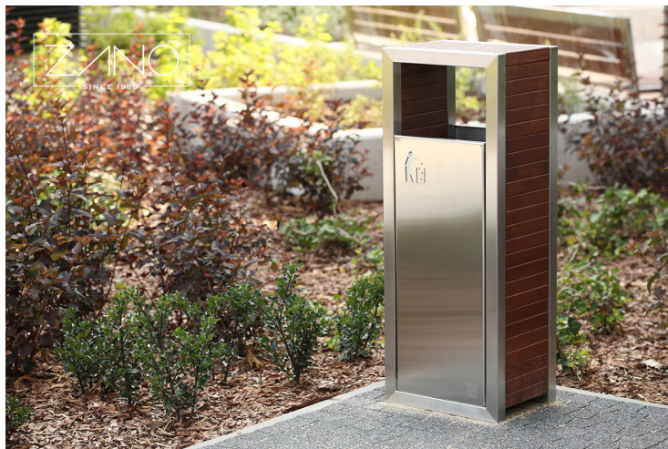
Rys. Poglądowe zdjęcie kosza na śmieci.