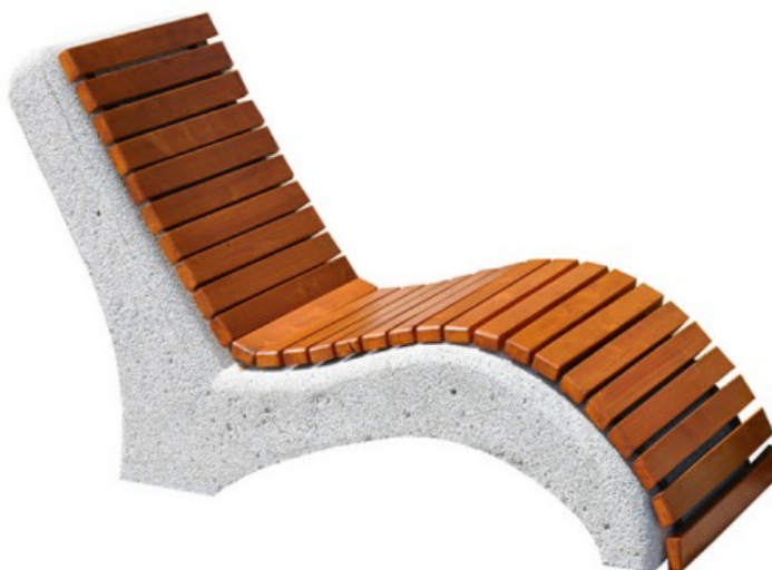
Rys. Poglądowe zdjęcie leżaka.