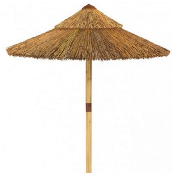
Rys. Poglądowe zdjęcie parasola