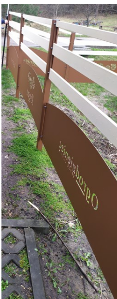
Rys. Poglądowe zdjęcie parasola