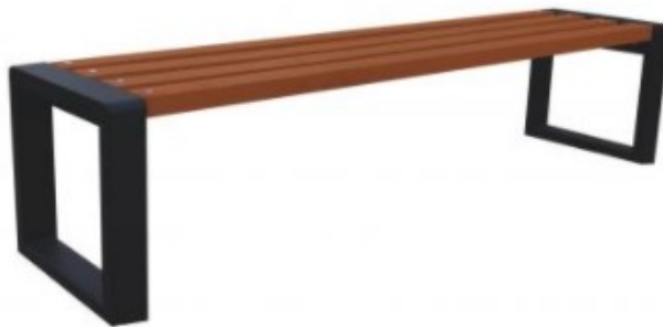
Rys. Poglądowe zdjęcie ławki.