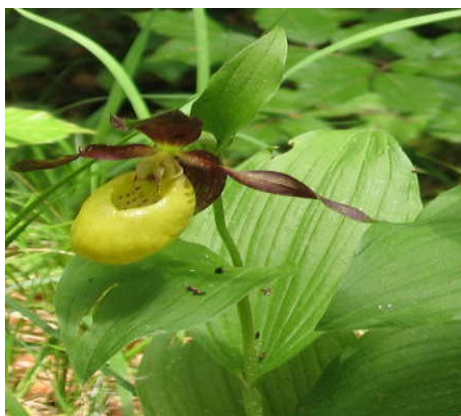
Rys. 4 Obuwik pospolity