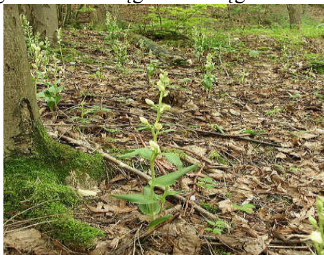
Rys. 3 Buczyna Storczykowata

Kolejnym obszarem NATURA 2000 częściowo położonym na terenie Gminy Ogrodzieniec są Buczyny w Szypowicach i Las Niwiski. Na ostoję składają się na nią trzy wyspy leśne: dwie o wielkości kilkuset hektarów i jedna, kilkunastohektarowa. Lasy liściaste stanowią 84% powierzchni terenu, lasy mieszane 12%, a lasy iglaste 3%, pozostałą część obszaru zajmują siedliska rolnicze. Runo występującej na tych powierzchniach ciepłolubnej buczyny jest bogate, ze szczególnie liczną grupą gatunków z rodziny storczykowatych. Ostoja jest również miejscem występowania bardzo licznych populacji obuwika pospolitego w dobrej kondycji, szczególnie w "Lesie Niwiskim". Ze względu na tendencje do zanikania stanowisk obuwika pospolitego w całej Europie opisywane stanowiska są bardzo cenne. Ponadto położone są one w pobliżu zachodniej granicy zasięgu, dlatego ich ochrona jest szczególnie ważna dla zachowania dotychczasowego kształtu i ciągłości zasięgu w Europie.