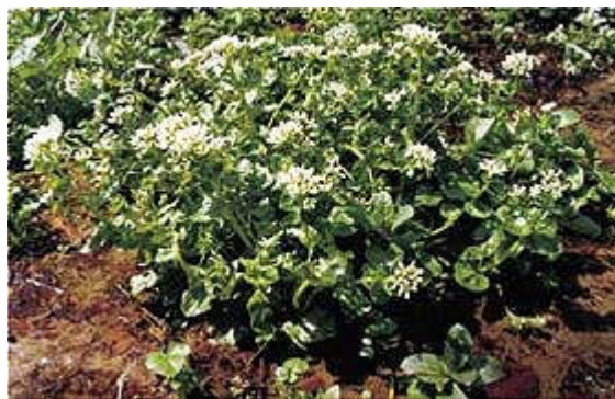
Rys. 2 Warzucha Polska

Wojewoda Śląski rozporządzeniem nr 22/04 z dnia 3 czerwca 2004 r. uznał za pomnik przyrody skupienie tworów przyrody nieożywionej – zespół źródeł rzeki Centurii, zlokalizowany na powierzchni 1,23 ha miejscowości Ogrodzieniec. Znajduje się tu najliczniejsze w Europie stanowisko warzuchy polskiej.