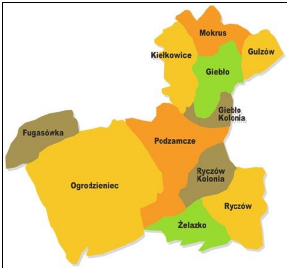
Rys. 1 Sołectwa i miasto gminy Ogrodzieniec

Dominującą formę zabudowy tworzy mieszkalnictwo jednorodzinne, a na terenach wiejskich rolnicze zagrodowe.