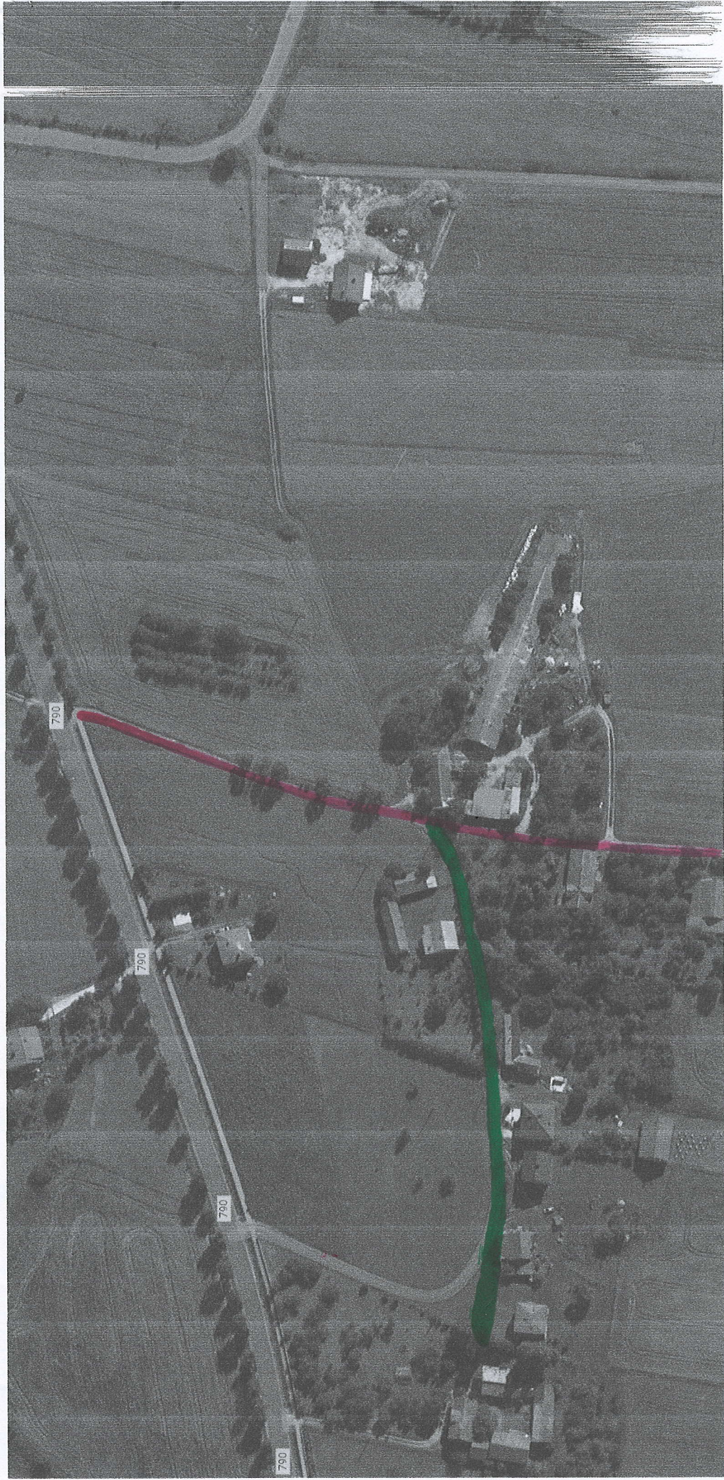
Zdjęcia ©2023 CNES / Airbus,Maxar Technologies,Dane mapy ©2023 20 m