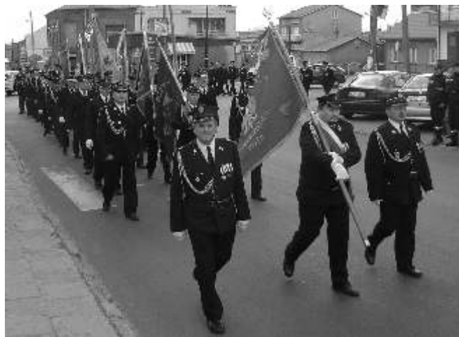
Uroczystości strażackie w Ogrodzieńcu...