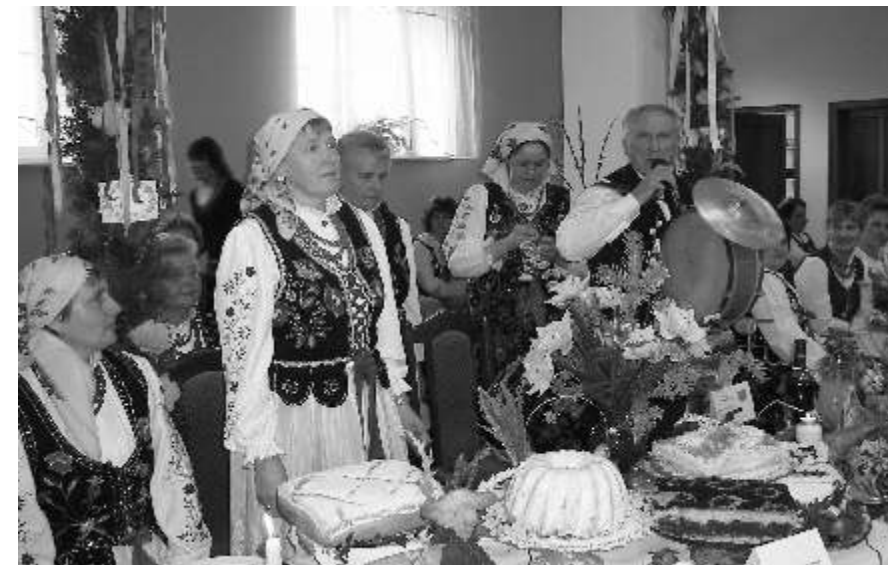
Zespół "WRZOS" podczas Turnieju KGW "Wielkanocna Baba", który odbył się w Żarnowcu.

W imieniu Zespołu Folklorystycznego „Wrzos” z Ryczowa Kolonii przy Kole Gospodyń Wiejskich złożony został również wniosek do Fundacji Wspomagania Wsi w Warszawie o dofinansowanie projektu „Pradziadowie, Dziadowie, Ojcowie i My z Ryczowa”.