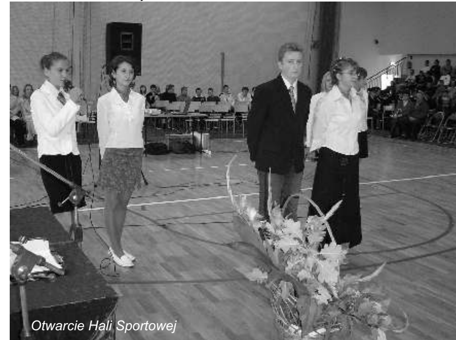
Otwarcie Hali Sportowej

budynku Domu Kultury w Ogrodzieńcu. Razem z moimi współpracownikami staramy się wykorzystać każdą szansę pozyskania środków z zewnątrz. W bieżącym roku udało się uzyskać dofinansowanie do remontu dworku