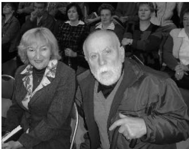
Jedno z ostatnich zdjęć Dyrektora, wykonane podczas otwarcia Hali Sportowej przy Gimnazjum w dniu 17.09.2005r.