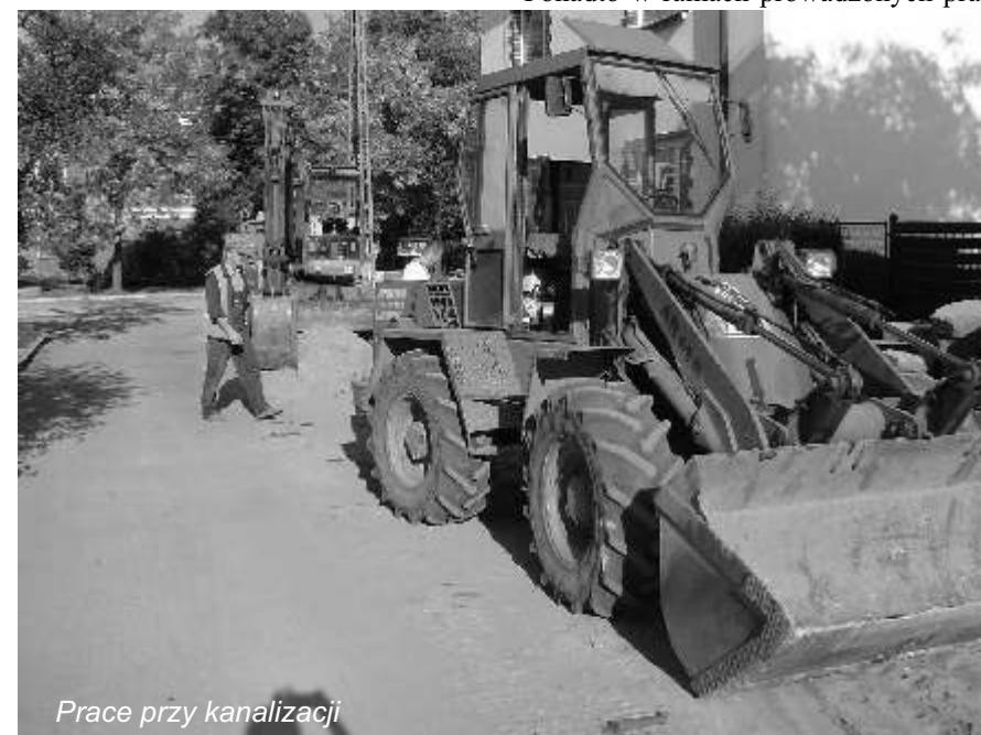
Prace przy kanalizacji